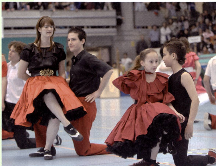
Dieci minuti per rilanciare lo sport scolastico facoltativo.