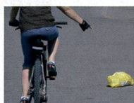
Attenzione, oggetto o buco sulla strada. Scansarlo!