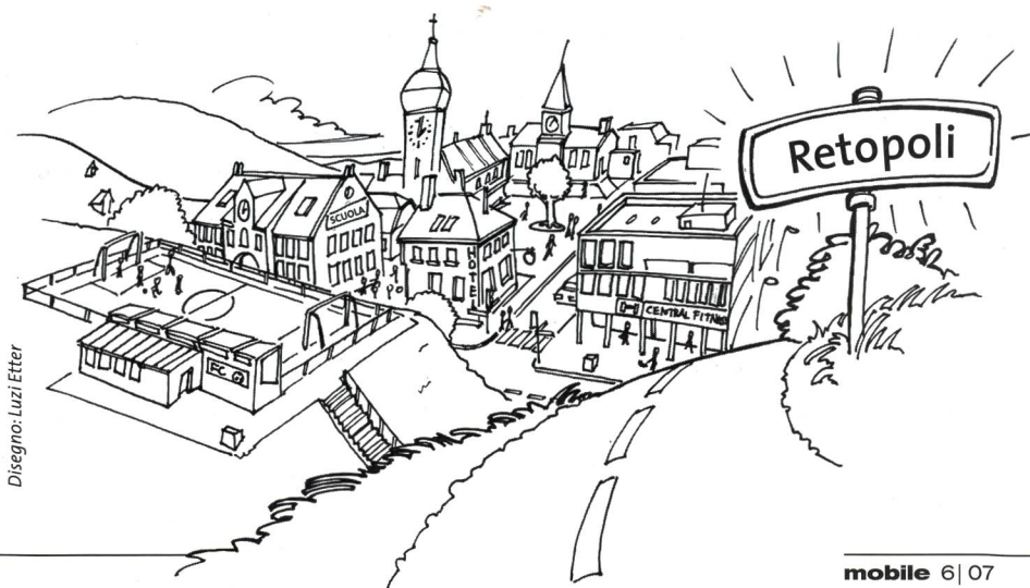
Disegno: Luzi Etter

► Il fascicolo «Tutti a Retopoli» può essere ordinato gratuitamente all'indirizzo internet www.svizzeraainmovimento.ch