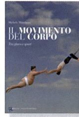
Marchetti, M.: Il movimento del corpo. Tra gioco e sport. Roma: La Meridiana Edizioni, 2010.

Si inizia così: con gioco e movimento. Si prosegue con lo sport. Ad attraversare il tutto, la vita nella sua principale rappresentazione, evidente ed indubitabile: il corpo, anche perché, ormai, il dualismo corpo/mente non regge più. La persona è unità di corpo-anima-spirito. Ma la persona si può scrutare con diverse lenti. Queste pagine una scelta la fanno. Scelgono d'indossare le lenti dell'antropologia cristiana (ammettendo, però, i limiti conoscitivi e di intelligenza) e provano a guardare. Propongono un'osservazione, anzi avanzano una descrizione. Sperando di educare attraverso lo sport. Questo, però, va padroneggiato, immaginato, progettato, amato e conosciuto, per non cadere negli stereotipi.