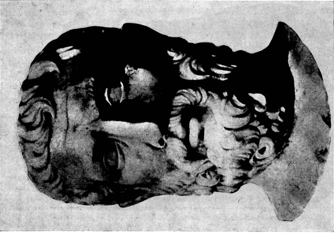
Abb. 3. Parmenides (Velia)