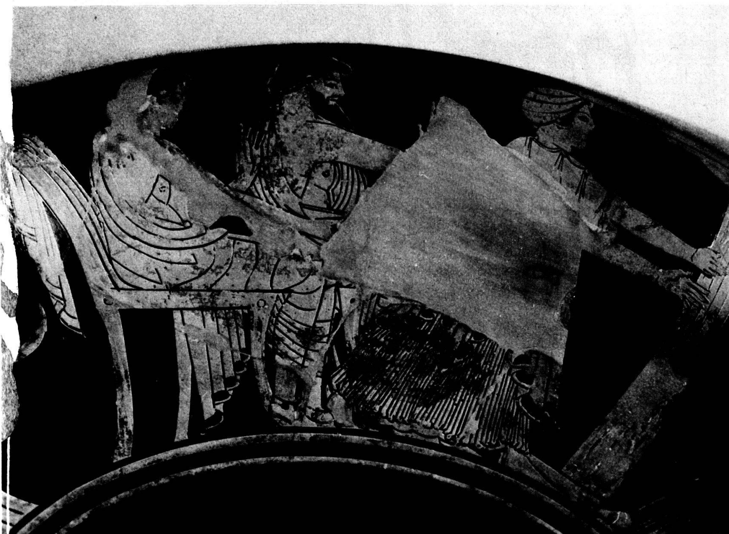
Planche 1. Francfort/Main. Liebieghaus. Coupe du peintre de Castelgiorgio.