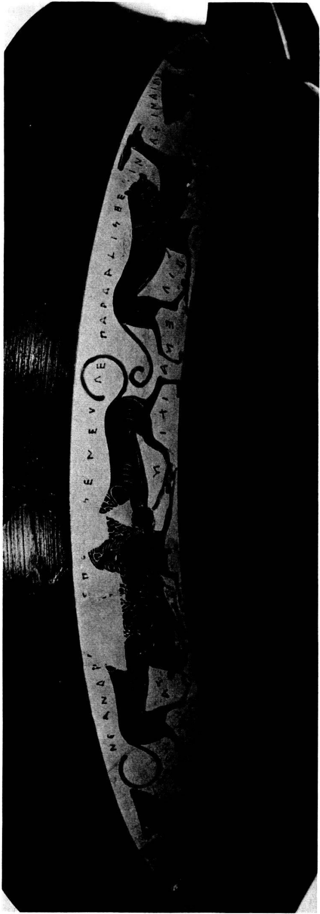
Tafel 2. Ausschnitte aus Tafel 1.