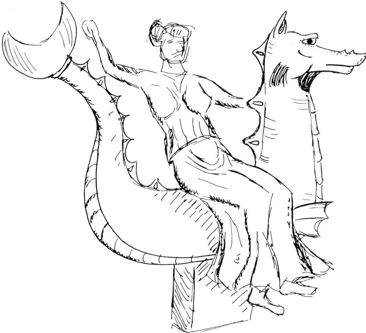
Textabb. 2. Rekonstruktionszeichnung der Skulptur Abb. 1–4, Zeichnung Verf.

haben muss 54 . Da sich die Friedhöfe der Antike zumindest ab der klassischen Zeit ganz generell entlang der Ausfallstrassen der Siedlungen aufreihen 55 , ist davon auszugehen, dass auch das Ketos-Monument einst in der Nähe eines Strassenverlaufes stand, um den Vorbeigehenden vom Reichtum und Ruhm des Verstorbenen und seiner Familie Zeugnis abzulegen.