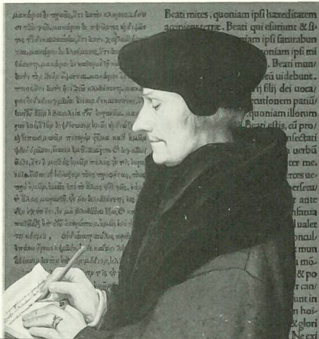
Das bessere Bild Christi Das Neue Testament in der Ausgabe des Erasmus von Rotterdam

Schwabe Verlag Steinentorstrasse 13 CH-4010 Basel Tel. +41 (0)61 278 95 65 Fax +41 (0)61 278 95 66 verlag@schwabe.ch www.schwabeverlag.ch