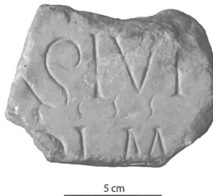
Fig. 4: Fragment d'inscription latine de Perly.

d'un M peut-être suivi d'un nouveau signe de ponctuation. Au-dessus de cette seconde ligne, la succession de petits S allongés et gravés moins profondément que les autres lettres paraît signaler la présence d'abréviations. Transcription diplomatique: