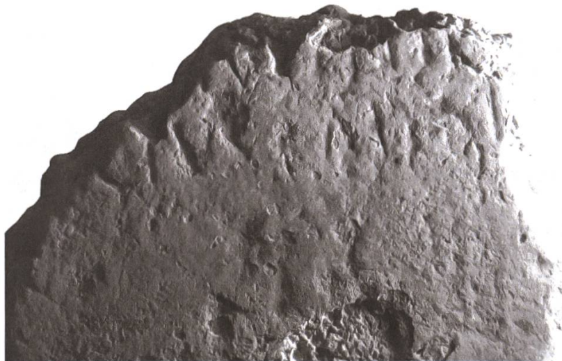
Fig. 1: Détail de l'inscription.

Les lettres, capitales, sont soigneusement gravées. À la l. 1, leur hauteur n'est pas mesurable. À la l. 2, elle est de 4,5 cm (I ou T long à la l. 2: 6,5 cm).