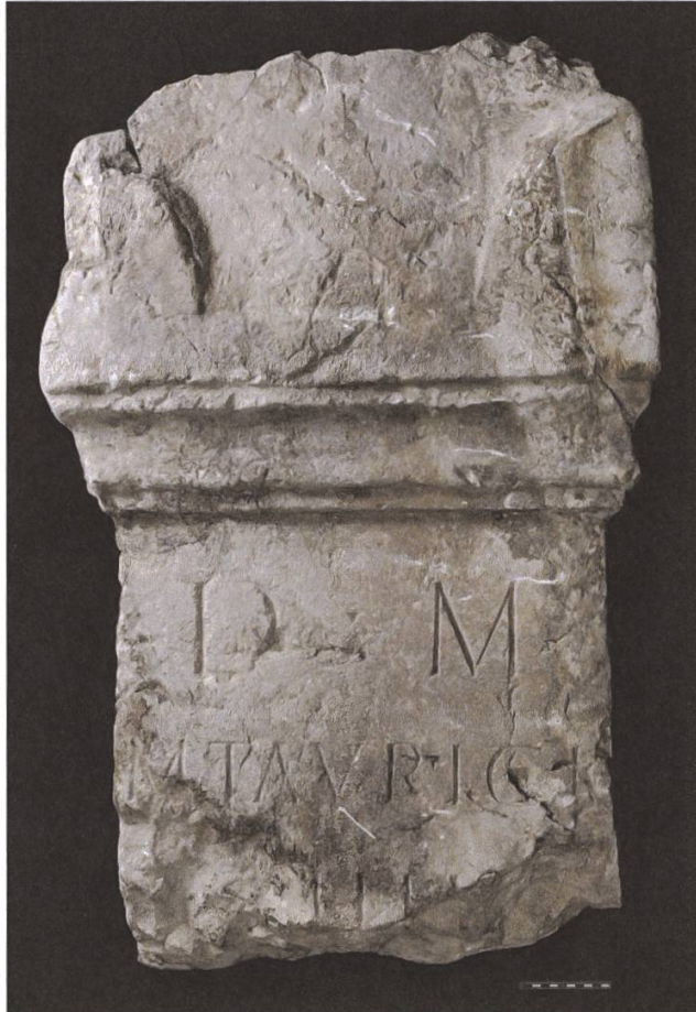
Fig. 3: L'autel funéraire de Barberêche.

Dans le cadre de travaux de restauration de l'église, le décrépiage des façades a révélé la présence de tuiles et de blocs architecturaux antiques en remploi dans les maçonneries. Parmi les spolia , on compte, outre un fragment de colonne, un autel funéraire en calcaire blanc du Jura, retrouvé dans les fondations de l'angle sud-ouest du clocher, dont il a désormais été extrait pour être présenté sous le porche de l'église.