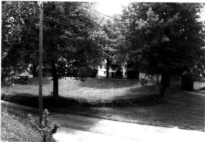
Abb. 6 & 7: Der Landgemeindepaltz, der Ring zu Ibach «vor der Brück». Die Bleistiftzeichnung stammt vermutlich von David Alois Schmid und zeigt den Landgemeindepaltz um die Mitte des 19. Jahrhunderts. Zu erkennen sind die Standorte der sechs Viertel. Der Platz präsentiert sich heute noch sehr ähnlich.