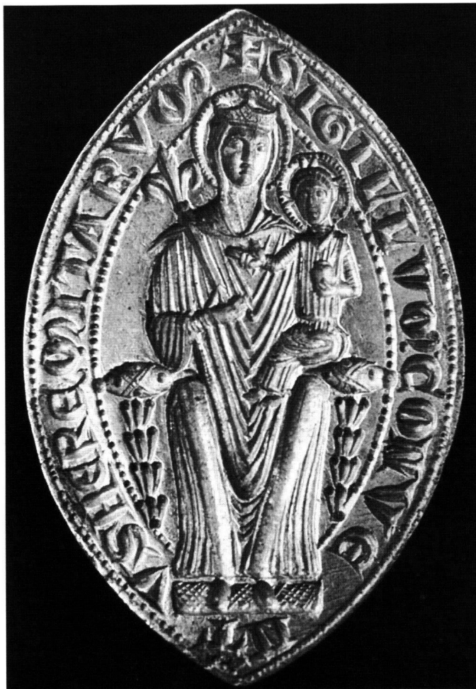
Abb. 4: Einsiedler Konventsiegel an einer Urkunde von 1239.

bulle und so weiter), von «Stecken» oder Pilgerstäben, die im «Vorzeichen» feilgeboten wurden. 72 Hingewiesen wurden die Pilger auf den alten Brunnen auf dem Platz vor dem Kloster mit seinem wirkmächtigen Wasser, 73 wie auch auf die Möglichkeit, Einsiedeln verbunden zu bleiben durch das Einschreiben in die «Bruderschaft». 74 Unerwähnt bleibt in den zeitgenössischen Berichten und Aufzeichnungen der sicher damals schon geübte Brauch, das sogenannte «Handzeichen des Herrn» zu berühren, beziehungsweise die Finger in die fünf Vertiefungen über der Kapellen-Türe zu legen. 75 Praktisch nichts erfahren wir über das Verhalten der Pilger bei den sogenannten Wegzeichen (Kapellen, Kreuze) in der Nähe des Klosters. 76