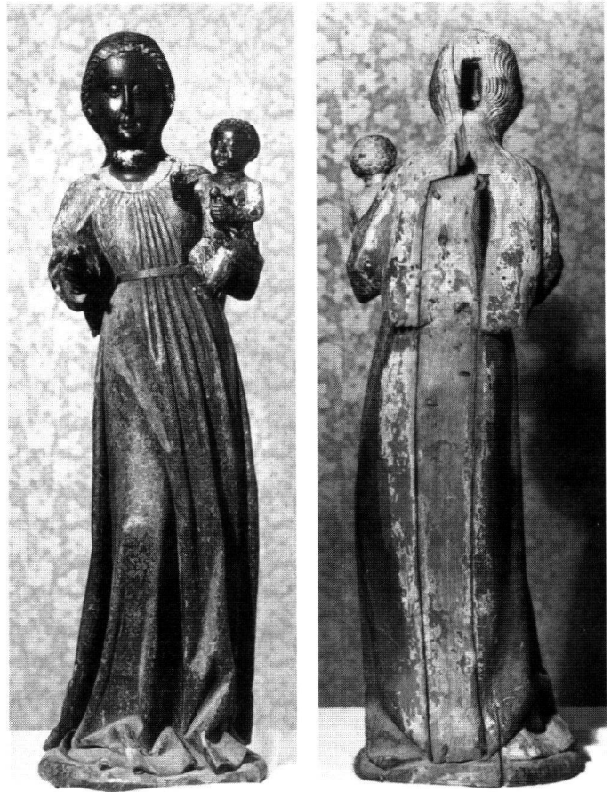
Abb. 5, 6: Schwarze Madonna von Einsiedeln, ohne Behang, vor der Restaurierung des Gnadenbildes 1933/1934. Aufnahme vom 16. September 1933. Die «langrechteckige Aushöhlung» im Hinterkopf des Gnadenbildes (Bild 6) diente möglicherweise der Aufnahme von «Heiltum».

1311 ist der Kreuzgang (oder Bittgang) der Schwyzer zu U. L. Frau von Einsiedeln erstmals urkundlich bezeugt. Dem Schwyzer Kreuzgang folgten andere Landeswallfahr-