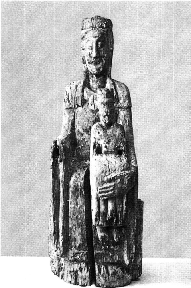
Abb. 3: Romanische Marienfigur von Einsiedeln, Privatbesitz. Möglicherweise älteste Marienstatue in der Einsiedler Gnadenkapelle, 12. Jahrhundert, Anfang des 13. Jahrhunderts durch eine «reicher gestaltete romanische, ebenfalls sitzende Madonna» ersetzt, wie sie das Konventsiegel um 1239 zeigt.

Anrufen der Mutter Jesu, in der Mitfeier der Gottesdienste, im Erlangen der vielen, vor allem nur in Einsiedeln erhältlichen Ablässen und so weiter suchten die sehr grossen Pilgerscharen Gnade, Trost und Heil, Sicherheit und Versicherung für das ewige Leben. 52