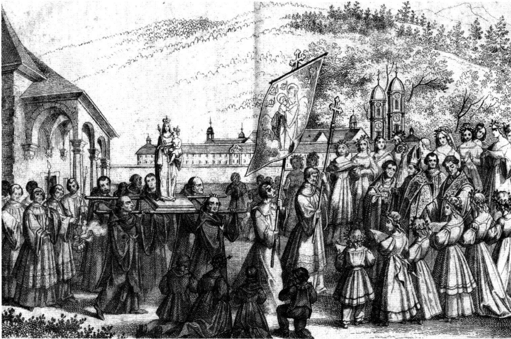
Abb. 5: Empfang des Gnadenbildes am 29. September 1803.