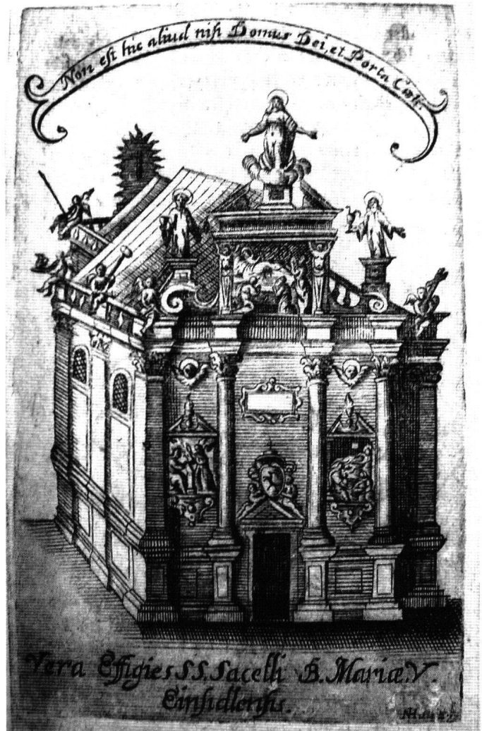
Abb. 2: Einsiedler Gnadenkapelle vor der Zerstörung durch die Truppen General Schauenburgs im Mai 1798. Kupferstich von N H, um 1750.

deln eintrafen und berichteten, wie die Franzosen in eroberten Orten hausten, begann man im Kloster ernsthaft Vorsorge zu treffen, um Kostbarkeiten, Reliquien usw. und vor allem das Gnadenbild in Sicherheit zu bringen. Man wollte « das Heilige nicht den gottesschänderischen Beschimpfungen muthwilliger Soldaten » 40 preisgeben. Vor allem aber wollte man, wie Abt Konrad Tanner in seiner um 1808 geschriebenen « Relation ... über die Schicksale des Einsiedlischen Gnadenbildes während der Französischen Revolution » betonte, verhindern, dass « die göttliche Mutter selbst in ihrem Bilde, wie es die Absicht und Wunsch der damaligen Machthaber war, in einem spöttlichen Triumphe auf Paris in das