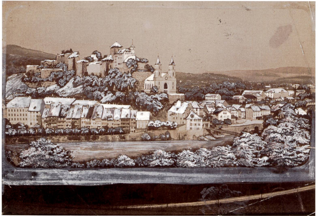
Abb. 4: Aarburg im Winter, Ende 19. Jahrhundert.

zustrebten. Der französische König Ludwig XVIII., dem Reding in offizieller Mission zur Thronbesteigung gratulierte, schmückte ihn 1816 mit dem Grafentitel. Redings Begegnung mit den gekrönten Häuptern der Restauration mag ihm die politischen Niederlagen etwas versüsst haben. Am 5. Dezember 1817 «erschütterte der Tod seiner über alles geliebten Tochter aus erster Ehe seine angeschlagene Gesundheit». Kurz nach der Teilnahme an der Gersauer Konferenz vom 19. Januar 1818 erkrankte er selber an schwerer Erkältung, einem «Entzündungsfieber», zwei Wochen später starb er. 60