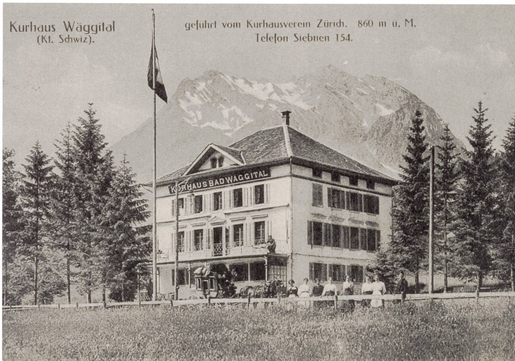
Abb. 2: Seit 1894 verkehrte eine Postkutsche bis alt Innerthal. Die meisten Reisenden waren Gäste des neu erbauten Kurhauses Bad Waggital. Auf dem Foto stehen hinter dem Zaun wohl Bedienstete – vorwiegend weibliche – des Betriebes, links von ihnen die zweispännige Postkutsche.