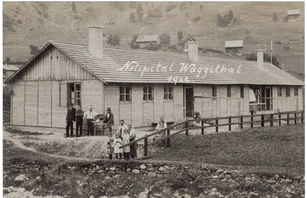
Abb. 4: Am Bau des Wasserkraftwerks im Wägital waren Schweizer und viele Arbeiter aus Italien oder Spanien beteiligt. Unter der Arbeiterschaft kam es wohl immer wieder zu Radau. Ausserdem gab es gesundheitliche Gefährdungen, etwa durch auftretendes Erdgas nach Sprengungen. Die Patienten wurden im eigens errichteten Notspital versorgt.

wohl auch Konflikte. Deshalb sei es im früher eher beschaulichen Wägital «uriëbig zuä- und häargange». 47 Zuerst habe man eine Verbindungs- und Transportstrasse errichtet. An der ganzen Strecke habe man Schlafbaracken und Kantinen erbaut. Die meisten Wägitaler nahmen Schlafgänger auf und profitierten somit zumindest kurzfristig vom Bau des Werks. Nutzniesser waren auch jene Wirtinnen und Wirte, die eigens neue, teilweise grosszügige Wirtshäuser bauten. Ein Holzbau mit Theater und Kino bot Platz für rund 500 Gäste! 48 Die Polizei hatte oft alle Hände zu tun, um bisweilen handgreiflich ausgetragene Konflikte zwischen Schweizern und Ausländern oder zwischen anderen Gruppierungen unter Kontrolle zu bringen. Die Welt der Bauarbeiter war eben eine raue. Der manchmal überbordende Alkoholkonsum liess den Gewaltpegel weiter ansteigen. Mit notorischen Streithähnen verfuhr die Bauleitung rigoros: Wer