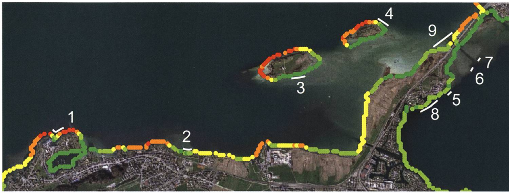
Abb. 3: Exposition der prähistorischen Fundstellen auf Schwyzer Kantonsgebiet im Oberen Zürichsee und Obersee: 1: Freienbach-Bächau; 2: Freienbach-vor der Kirche; 3: Freienbach-Ufnau; 4: Freienbach-Lützelau; 5: Freienbach-Hurden Kapelle; 6: Freienbach-Hurden Untiefe West; 7: Freienbach-Hurden Seefeld; 8: Freienbach-Hurden Rosshorn.

einem spezifischen naturräumlichen Kontext steht, in dem jeweils wechselnde hydrodynamische Bedingungen und Strömungen herrschen. Zudem sind Messungen, wie sie in Freienbach-Hurden Seefeld durchgeführt wurden, aufwändig und zeitintensiv und müssen vor Ort erfolgen.