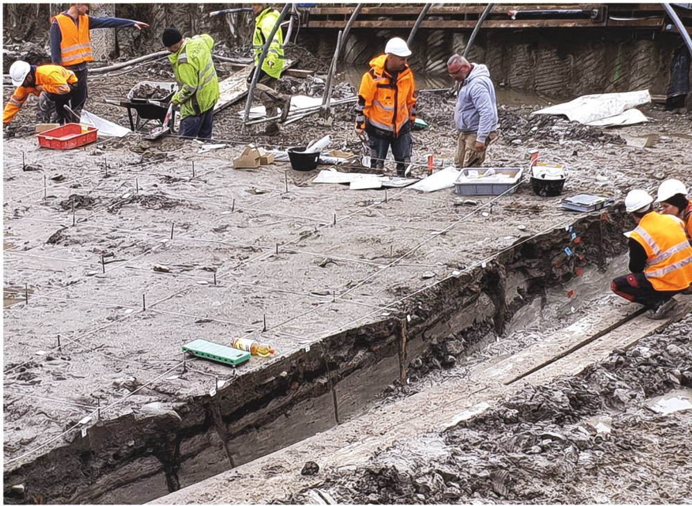
Abb. 2: In einer Rettungsgrabung in Immensee wurden 2020 mehrere Pfahlbau- beziehungsweise Kulturschichten (dunkle Schichten) dokumentiert.

Obersees konnten 1998 auch die Schwyzer Gewässer – im Auftrag des Kantons Schwyz – gezielt nach Hinweisen auf prähistorische Ufersiedlungen abgesucht werden. 2 Ziel war es, den Zustand der damals bereits bekannten Pfahlbausiedlung bei Freienbach vor der Kirche zu kontrollieren sowie Hinweise auf weitere Pfahlbausiedlungen zu finden – mit Erfolg: Beim Abschwimmen der Flachwasserzonen, die aufgrund der untiefen Seegrundtopografie als potenzielle Siedlungsgebiete der prähistorischen Bewohner gelten, entdeckten die Zürcher Taucher mehrere bislang unbekannt Fundstellen. 3