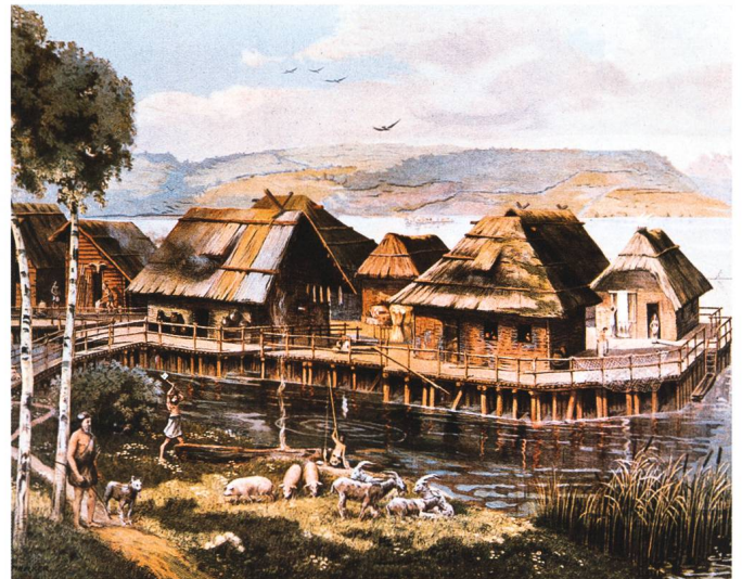
Abb. 1: Auguste Bachelin, «Village lacustre de l'âge de la pierre», 1867.

In unseren Seen und Flüssen befinden sich archäologische Zeugen aus mehreren Jahrtausenden – Mensch und Umwelt haben im Verlauf der Zeit ein Bodenarchiv der Vergangenheit geschaffen, das einmalig ist und es erlaubt, unsere zivilisatorischen Wurzeln zu entdecken. Die Fülle an Informationen dank der Erhaltung von organischen Materialien wie hölzerne Bauelemente von Pfahlbauhäusern, Fischernetze oder Kleidungsstücke, aber auch von nicht-organischen Materialien, Werkzeugen, Schmuck und Alltagsgegenständen, aus der Stein- und Bronzezeit waren der Grundstein für die 2011 erfolgte Ernennung der Pfahlbauten zum Unesco-Weltkulturerbe. Kleinste Pollenreste, verkohltes Getreide, Tier- und Pflanzenreste geben Auskunft zu den Lebensumständen und dem Naturraum der damaligen Bevölkerung. Die Reste der Pfahlbauten haben unter Luftabschluss Jahrtausende überdauert. Sie dokumentieren unsere Kultur- und Naturgeschichte von 4300 bis 800 vor Christus. Mit ihnen lassen sich die Entwicklung jungsteinzeitlicher und metallzeitlicher Siedlungsgemeinschaften im Kontext mittel-, südost- und westeuropäischer sowie mediterraner Kulturtraditionen erforschen. Im