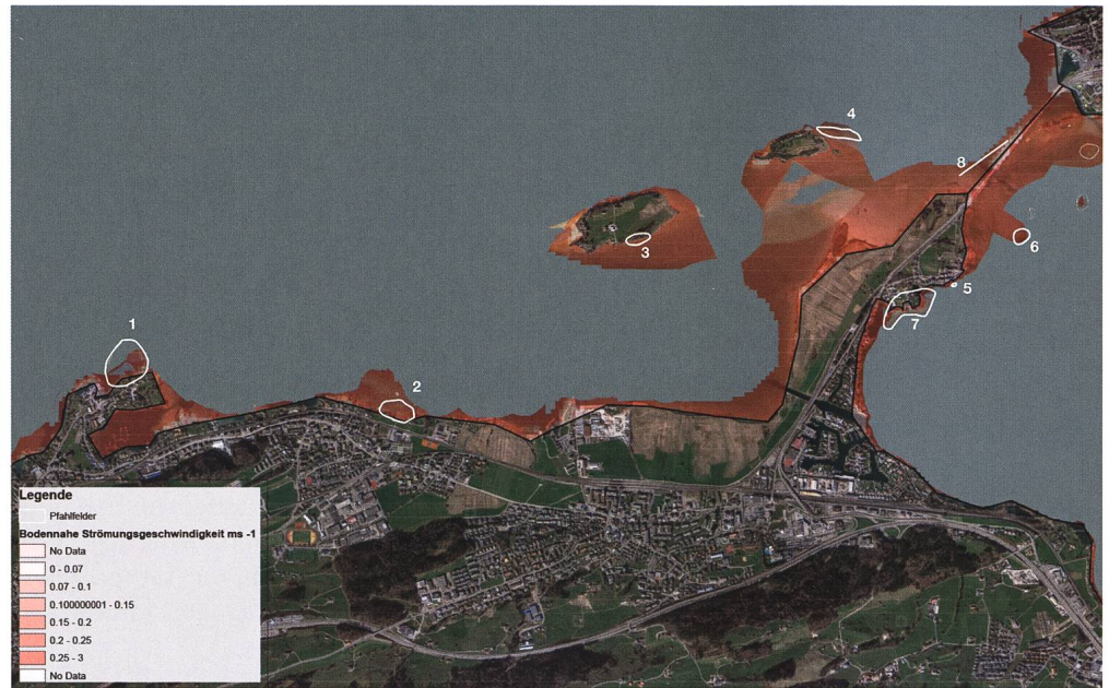
Abb. 4: Darstellung der bodennahen Strömungsgeschwindigkeiten.

Sedimentpartikel aufgewirbelt und können transportiert werden: Es findet Erosion statt, die die Substanz von archäologischen Fundstellen abbaut. Dass diese Werte bei allen ufernahen Fundstellen des Kantons Schwyz erreicht und teilweise deutlich übertroffen werden, zeigt sich in der differenzierten Darstellung des Jahresmittels der bodennahen Strömungsgeschwindigkeiten. Es liegt auf der Hand, dass einzelne Sturmereignisse viel grössere Strömungsgeschwindigkeiten erreichen und damit die Erosion wesentlich erhöhen: Je nach Windrichtung sind einzelne Fundstellen dann besonders exponiert. Die Modellierung zeigt bei östlichen Winden die besondere Exposition der Fundstellen Freienbach-Hurden Kapelle, Freienbach-Hurden Untiefe West und Freienbach-Hurden Seefeld. Bei Winden aus westlicher und nördlicher Richtung sind diese besser geschützt, während in den Flachwasserzonen zwischen Ufnau, Lützelau und Hurdener Landzunge Strömungsgeschwindigkeiten von 0.3–1 m/s auftreten können.