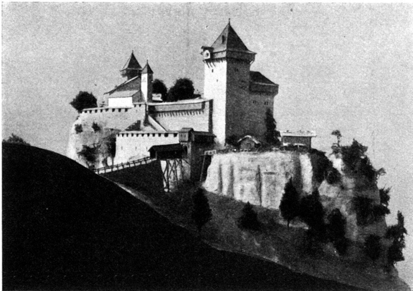
Die Grasburg, nach einem Modell von H. Defatsch in Zürich