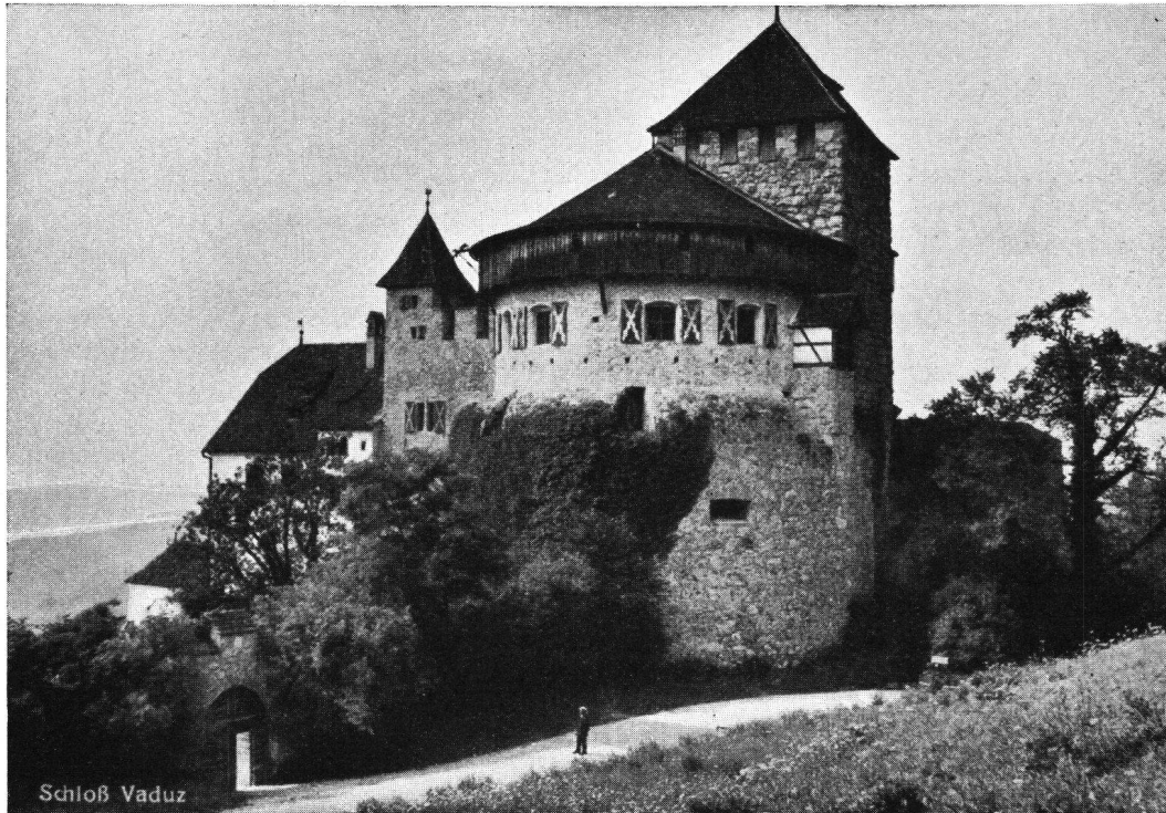
Schloß Vaduz im Fürstentum Liechtenstein, das besucht wird