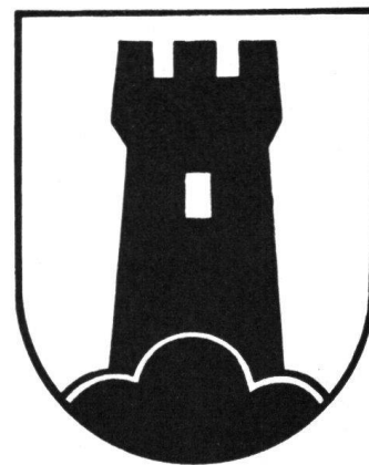
Wappen der ehemaligen Herren von Altstetten (Zürich), nachmals Gemeindewappen

Während in der schweizerischen Heraldik die Burg und auch der Turm zumeist in einfacher stilisierter Form zur Darstellung gelangen, war es in Deutschland, Österreich und Ungarn beliebt, bei den vielen Städtewappen, die eine doppeltürmige oder dreitürmige Burg führen, bis ins einzelne gehende Architekturzeichnungen zu geben. Für eine heraldisch vorbildliche Wiedergabe der Burg im Wappen dürfte aber doch die gerade durch die Einfachheit so frisch und so eindrucksvoll wirkende Darstellungsart des 14. Jahrhunderts den Vorzug verdienen.