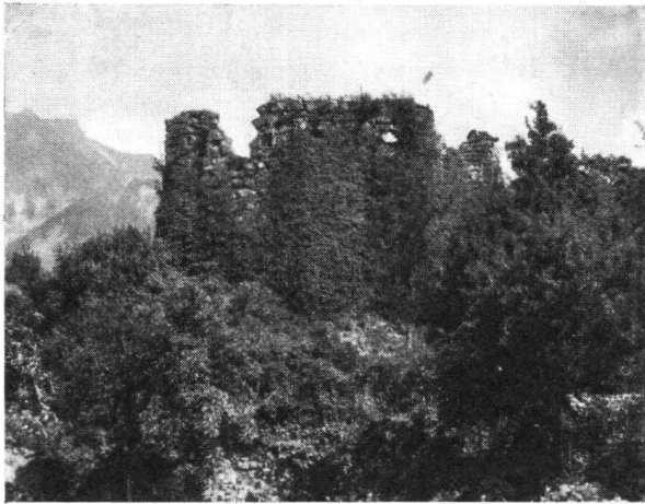
Die vollständig von Efeu umspinnene Ruine Forstegg vor der Restaurierung