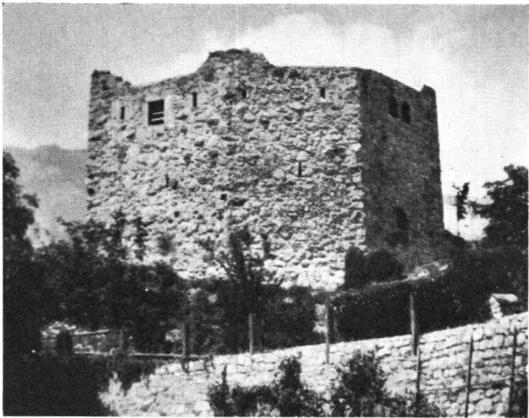
Die Ruine Forstegg nach der Restaurierung

deß Felsens niedrigstem Ort / also daß es damals unüberwindlich / vnd ein Vestung genennet worden. Hat ein Sod-Brunnen im Felsen eingehawen / vnd im alten Thurn ein dreyfache Hand-Mühle.“