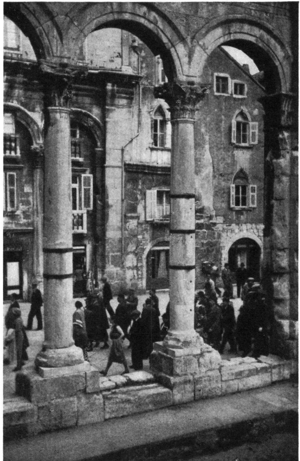
Im Palast des römischen Kaisers Diocletian in Split

Zu einem eindrucksvollen Erlebnis wurde uns auch die kleine mittelalterliche Stadt Tro-