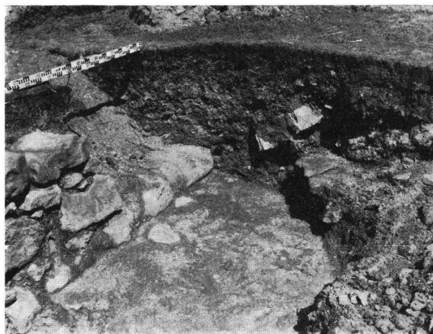
Ahaburg, Innenseite des Turmfundamentes mit Mörtelboden

Die Bodenkuppe ist fast quadratisch im Ausmaß von gut 10 m, etwa 1 m über das Umgelände ragend, auf allen vier Seiten leicht ansteigend und mit Wasen bedeckt. Unschwer konnte man unter dieser