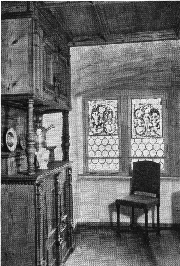
Frauenfeld Schloß Frauenfelderstübli mit Buffet, Täfer und Decke aus dem ehem. Gasthaus zur Sonne, 1663–1665