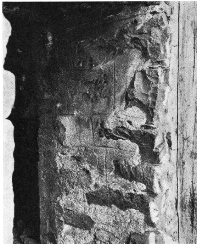
Bürglen UR Eingang zum Turm 3 mit mittelalterlichem Fugenstrich

Aus dem beigelegten Situationsplan geht hervor, daß die Türme weder gleiche Grundrisse noch gleiche Mauerstärken aufweisen. Ebenso ergab ein persönlicher Augenschein, daß die Mauertechnik bei den drei Türmen, von denen noch aufsteigendes Mauerwerk erhalten blieb, verschieden ist. Sie sind demnach nicht in der gleichen Zeit gebaut worden und können nicht zu einer einheitlichen Talsperre, wie es von früheren Historikern angenommen wurde, gehört haben. – H. Sr. Literatur: H. Zeller-Werdmüller, Denkmäler aus der Feudalzeit im Lande Uri, Mitteilungen der Antiquarischen Gesellschaft in Zürich, Band 21; P. Kläui, Die Meierämter der Fraumünsterabtei in Uri, Histor. Neujahrsblatt Uri 1955/56 S. 7; P. Kläui, Bildung und Auflösung der Grundherrschaft im Lande Uri, Histor. Neujahrsblatt Uri 1957/58 S. 40.