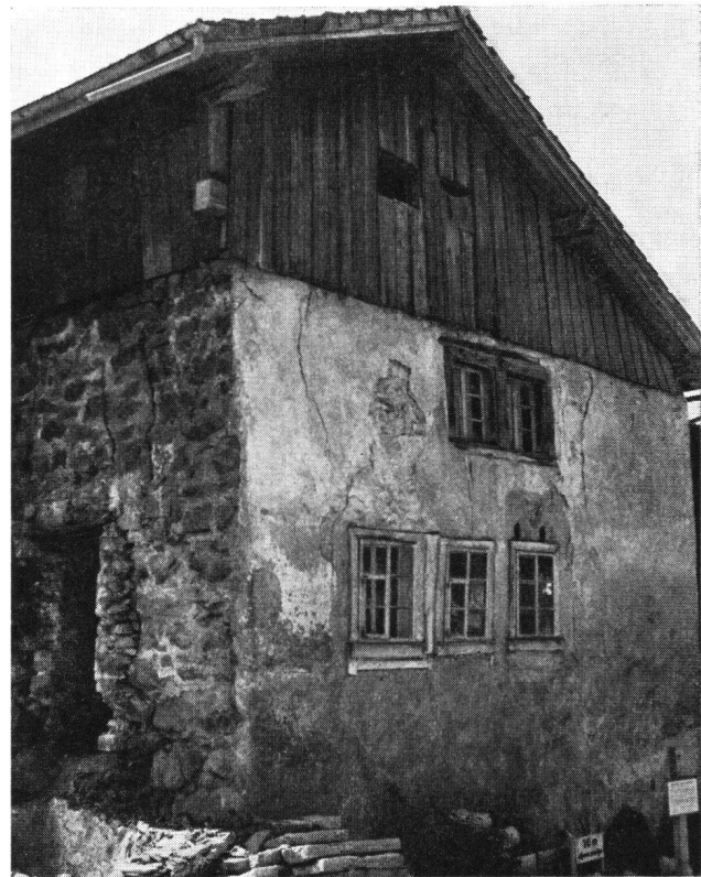
Bürglen UR Der jetzt vom Bauernhaus befreite Turm 3

Unter der Ägide des rührigen Pfarrhelfers Schäuber in Attinghausen hat sich ein Komitee gebildet, welches die Schaffung eines Tellmuseums plant. Ein reiches Bildmaterial ist bereits gesammelt, und eine dauernde Ausstellung würde sich rechtfertigen. Als Museumsbauten sind die beiden Türme (Meierturm und heute freigelegter Turm) ins Auge gefaßt worden. Umfassende Restaurierungs- und Konservierungsarbeiten wären vonnöten. Auch der Innenausbau würde ein tüchtiges Stück Arbeit verlangen. Wir hoffen, daß dann, wenn diese Türme in absehbarer Zeit instand gestellt werden, sich Gelegenheit bietet, Sondierungen vorzunehmen, welche neues Licht in die Geschichte dieser für die Urschweiz bedeutenden Wehrbauten bringen würden.