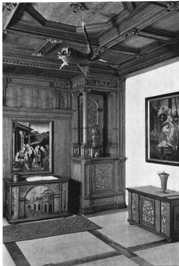
Beichtigerzimmer aus dem ehem. Kloster Tänikon TG. Getäfer des Meisters HS, 1569