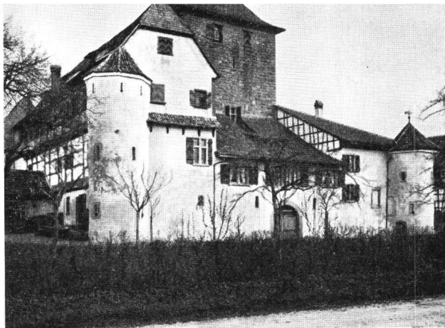
Hegi ZH Schloß, Ansicht von Westen

XXXIII. Jahrgang 1960 5. Band Juli/August Nr. 4