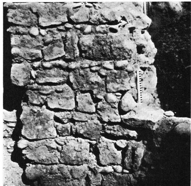
St. Albanvorstadt Basel, Innenmantel des Schalenturmes

Die Befestigung bestand aus einem acht Meter breiten und fast fünf Meter tiefen Trockengraben, und