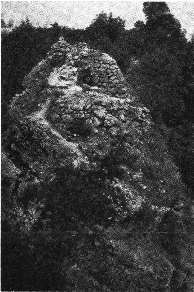
Froburg, Reste der Torbefestigung Von diesem Mauerwerk sind heute nur noch wenige Spuren übrig