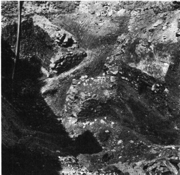
Basel, St. Alban-Vorstadt 36. Stadtmauer mit Schalenturm