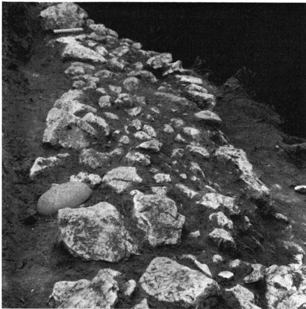
Burg Winznau, Steinsetzung in F 1

vierte Seite war überhaupt nicht begonnen worden. Das Innere der geplanten Feste blieb weitgehend unberührt, und der Graben wurde auch nie vollendet.