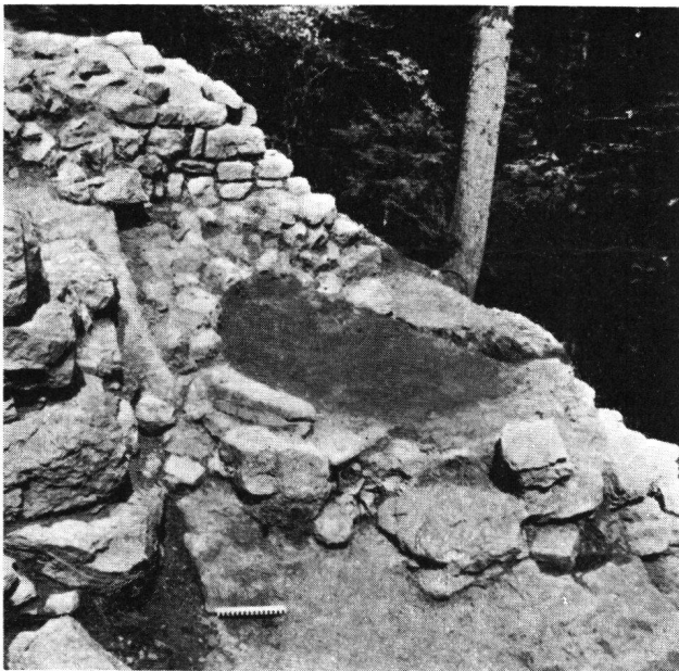
Burg Grenchen, Backofen

sporns und dürfte vom östlichen Rampenende aus über eine entfernbare Holzkonstruktion zugänglich gewesen sein.