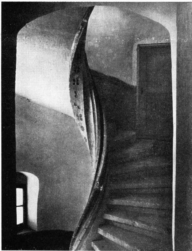
Schloß Pruntrut, Wendeltreppe Residenzgebäude

1961 sind die Restaurierungsarbeiten am Schloß, für welche das Bernervolk am 2. September 1956 einen Kredit von 2 Millionen Franken bewilligt hatte, abgeschlossen worden.