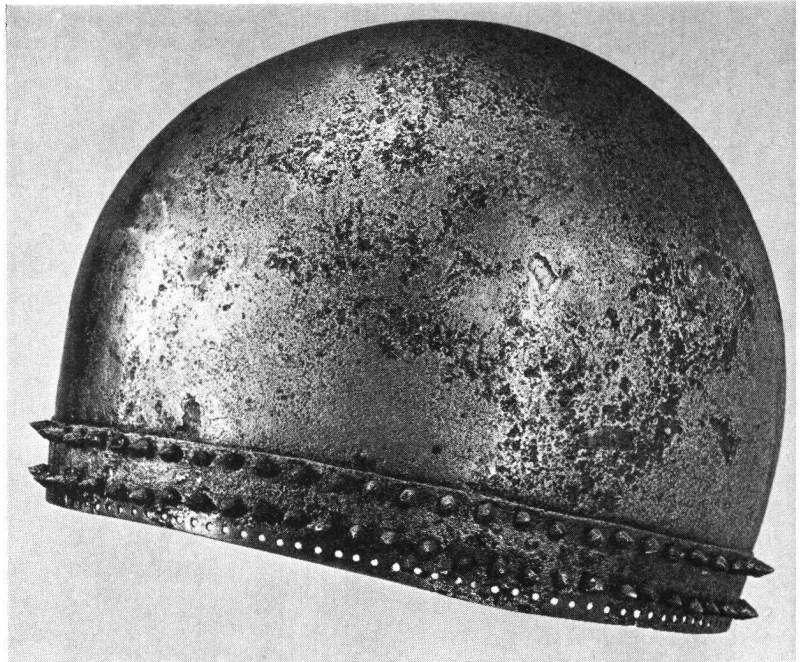
Niederrealta GR Helm, ergänzt und konserviert

Erscheinen jährlich sechsmal XXXVII. Jahrgang 1964 6. Band November/Dezember Nr. 6