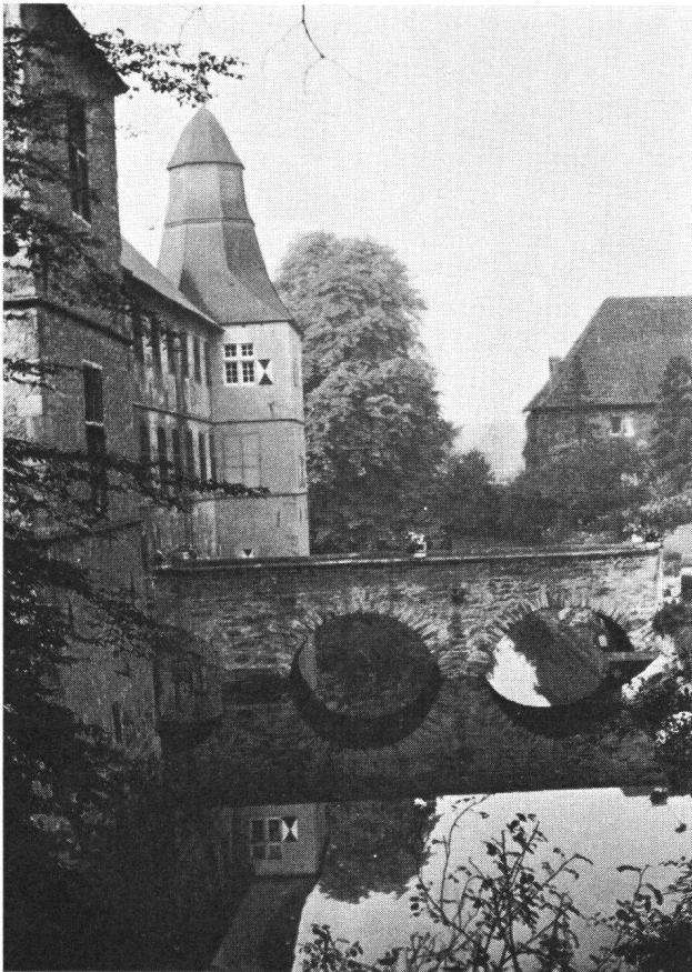
Westerwinkel Westfalen, Schloß

lung wird er unsere Erinnerungen an die gelungene Burgenfahrt 1963 nach Westfalen nochmals aufleben lassen.