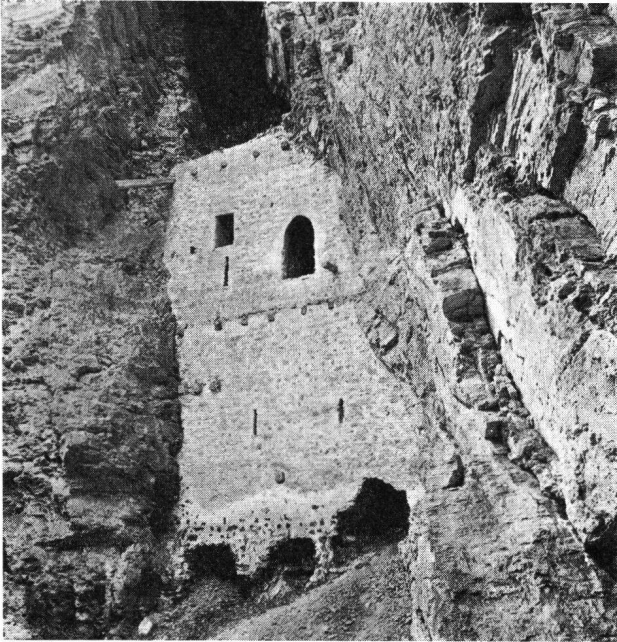
Rappenstein GR Ansicht von NW