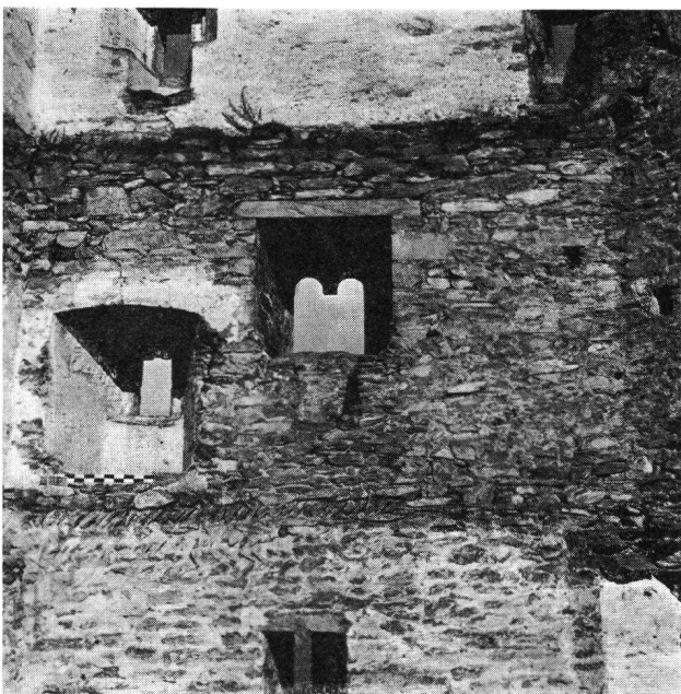
Haldenstein GR Palas E-Innenwand mittl. Drittel