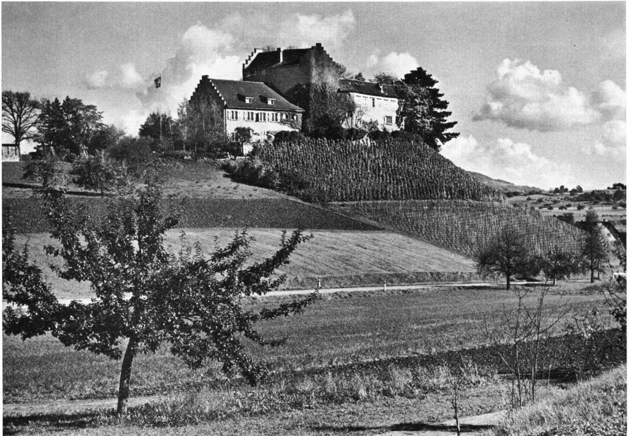
Schloß Schwandegg ZH

Kaum hatte ich die große Eingangshalle betreten, bemerkte ich zu meiner freudigen Überraschung, daß sich hier, in dieser schönen, alten Besetzung, vieles verändert hatte. Von seiner einstigen Verwahrlosung war