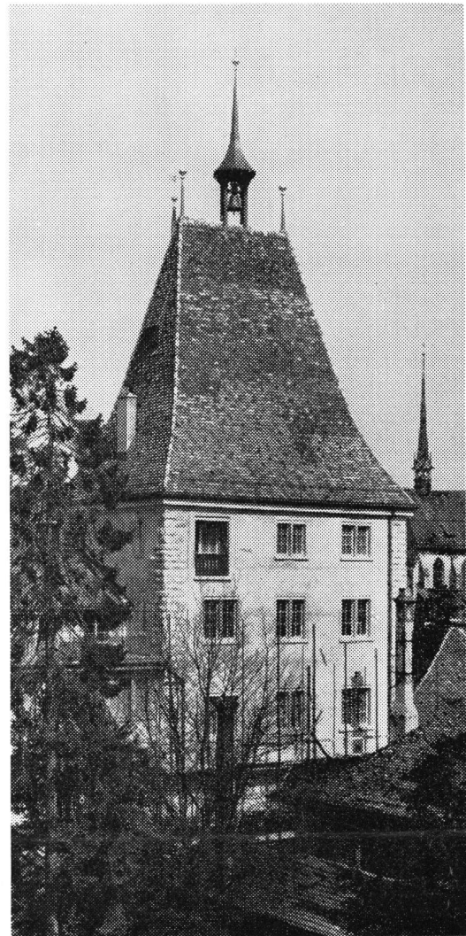
Zürich Grimmenturm. Ansicht von der Unteren Zäunerher. Im Hintergrund die Predigerkirche.

Als Grenzen des Bannkreises werden die Sihl und die darüberführende Brücke, alle Stadttore, der «burger wighuser» und der Bereich der ehemaligen oder noch bestehenden Pferdweiden der Bürger angegeben. «Hengste» muß trotz verschiedenen Deutungsmöglichkeiten mit «Pferde» wiedergegeben werden, um so den gedanklichen Rahmen der Verordnung nicht zu sprengen. Die Wendung «stuonden ald noch stant» findet ihre Erklärung darin, daß sich die sogenannte «dritte» Stadtbefestigung noch im Bau befand und es wohl möglich war, daß nun diese oder jene Grünfläche, welche ursprünglich außerhalb der Stadt gelegener Weidegrund gewesen war, nun in die Befestigungsanlagen einbezogen wurde. Wenn der angegebene Bannkreis die Grenze des städtischen Hoheitsgebietes angeben sollte, so bildeten die Tore, die Mauerzüge und die Stadttürme eine weithin sichtbare Abschränkung. Die im Zusammenhang mit den Toren kollektiv hervorgehobenen «wighuser der burger» sind nichts anderes als die bereits stehenden Stadttürme. Die andernorts im Richtebrief möglicherweise angeführten Adelstürme werden als «vestu hus» bezeichnet. Es zeigt sich wiederum, daß es sich bei «Wighaus» um ein altes Wort handelt, welches im täglichen Sprachgebrauch verlorenging oder nur mit gewandeltem Sinnesgehalt erhalten blieb. Die Stadttürme werden innerhalb des gleichen Schriftstückes später kon-