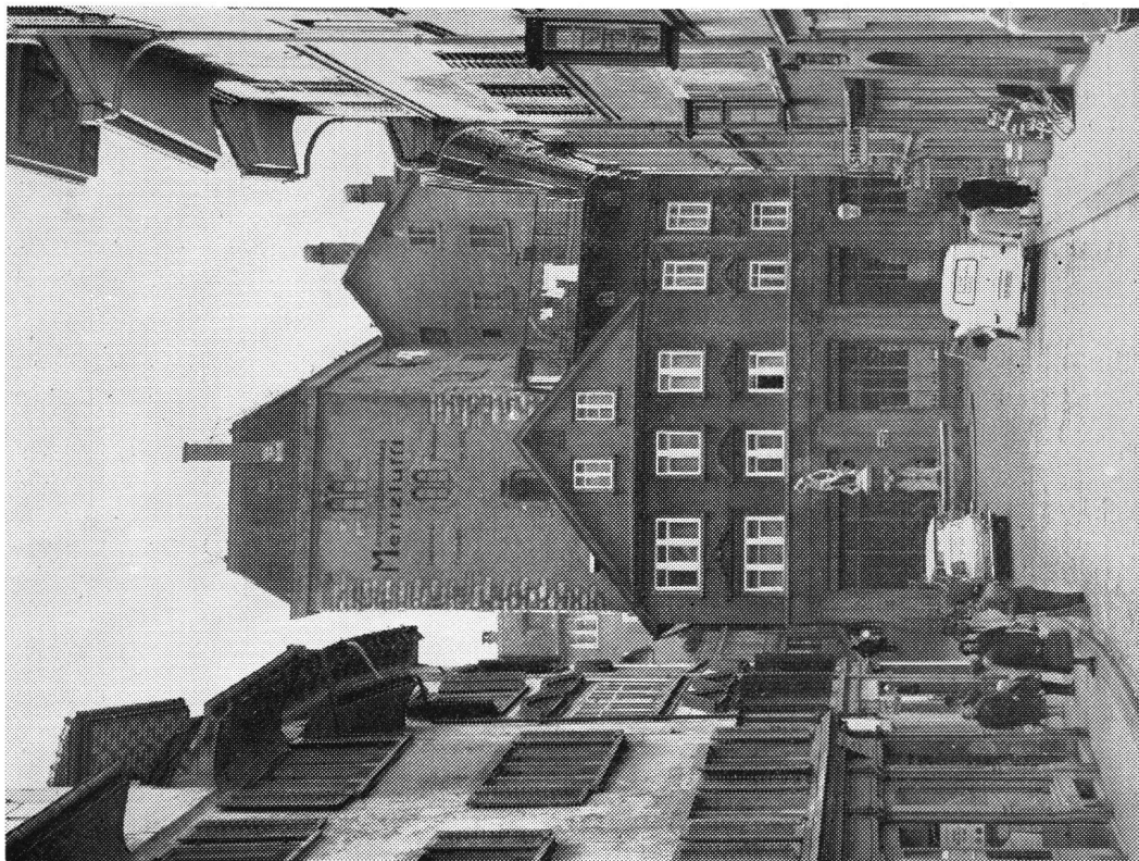
Zürich Grimmenturm. Die beiden Bilder veranschaulichen uns ein eindrückliches Beispiel aus der Tätigkeit der städtischen Denkmalpflege. Diesem typischen Adelsturm, der erst vor rund 100 Jahren bis zur Unkenntlichkeit verbaut wurde, konnte in einer gelungenen Rekonstruktion 1964–1966 das frühere Aussehen zurückgegeben werden. Alte Stiche und Zeichnungen bildeten die Grundlagedokumente zur Planung. Die Entwürfe zur künstlerischen Ausstattung wie Zifferblatt, Glocke mit Inschrift, Wetterfahne usw. schuf der bekannte Zürcher Grafiker Ernst Keller.