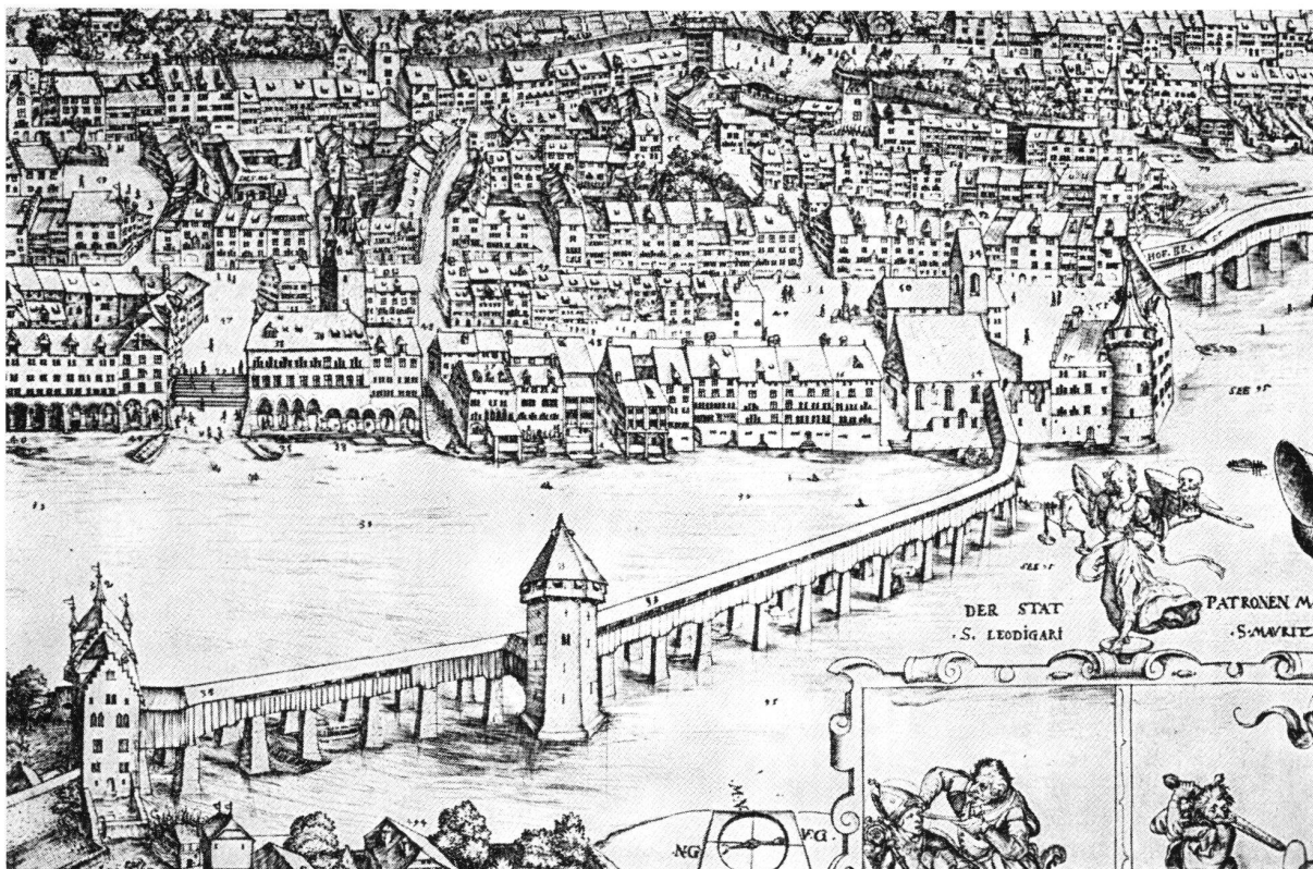
Plan der Stadt Luzern von Martin Martini (1597), Ausschnitt. Rechtsufrige Stadt mit Kapellbrücke, Rathaus, St.-Peters-Kapelle und Haus zur Gilgen. Das Wighaus umfaßt das rechte Brückenenende und die daran anschließende steinerne Befestigung.

«Eben zu der zyt und umb sölcher ursach willen wurden jm see an der statt by der Hoffbrugk und enthalb dem Wygkhus ussert der Cappelbrugk gegen dem ernern gelert, wie ouch oberhalb gegen Tribschen (wöllich vor zytten ein dorff gewesen) die schwirren, so man noch jetz sicht, geschlagen, damitt die 3 Lender, so domalen vvent warent und