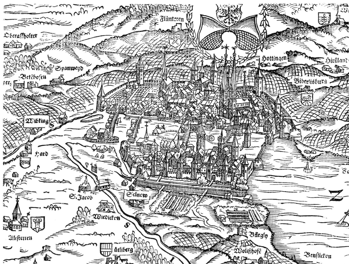
Zürich. Stadtprospekt. Ausschnitt aus der Karte des Kantons Zürich von Jos. Murer, 1566. Rechts von der Bildmitte ist wiederum deutlich der Wellenbergturn zu erkennen.

sol die stat und ouch die vorstette miden, als die w(a)sser silbrugge hie disenthalben anvahet, und dar noch al umbe die stat zallen torn, als der burger wighuser und ir hengste stuonden ald noh stant.» (F. Ott, Der Richtbrief der Burger von Zürich, Archiv für Schw. Geschichte, Bd. 5, 1847, p. 168)