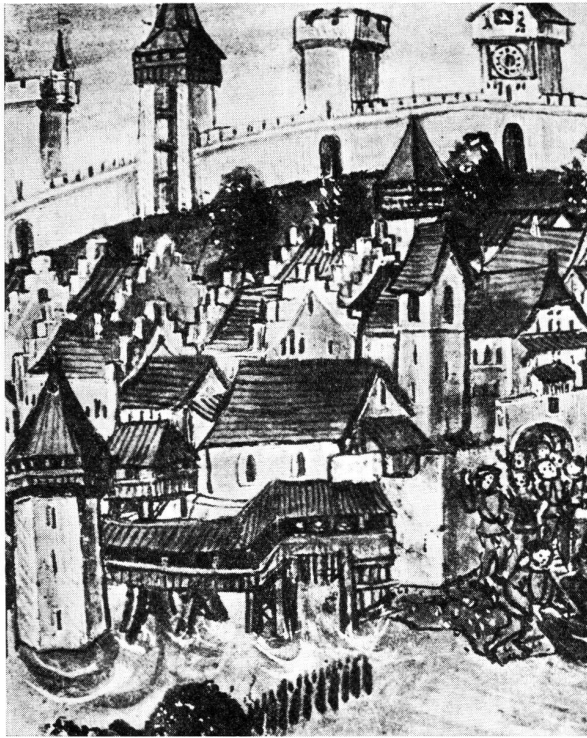
Luzern. Wasserturm, rechtsufrige Kapellbrücke und Wighaus. Im Hintergrund vier Türme der Museggmauer. Ausschnitt aus Tafel 84 von Diebold Schillings Luzerner Bilderchronik von 1513.

offtermalen by nacht ynfäl gethan, roub von vych und andern genommen und wider darvon gefaren.» (Renward Cysat, Collectanea, I. Teil, Luzern 1969, p. 242)