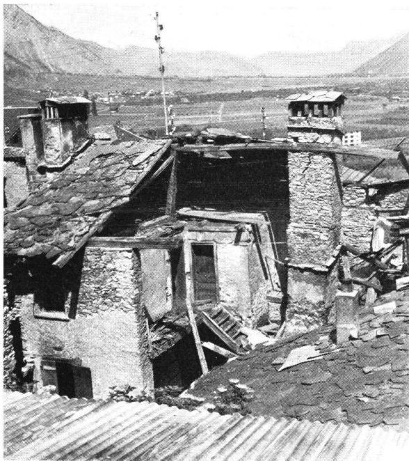
Saillon VS ... von der Rückseite besehen ist der Schaden um einiges schlimmer. Die Dachpartie mußte inzwischen wegen Einsturzgefahr abgetragen werden.

Die Gesellschaft besitzt heute ein Kapital von etwas über 200 000 Franken, das auf die erste Etappe verwendet wird. (Die erste Etappe beläuft sich auf 800 000 Franken.) Dies heißt in andern Worten, daß ein ungeheurer Aufwand geleistet wurde und daß das Haus in Saillon in nicht allzuferner Zukunft liegt.