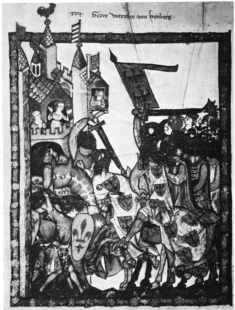
Wernher Graf von Homberg im Kampf um eine italienische Stadt. Manesische Liederhandschrift, um 1320.

Erscheinen jährlich sechsmal XLV. Jahrgang 1972 8 Band Nov./Dezember Nr. 6