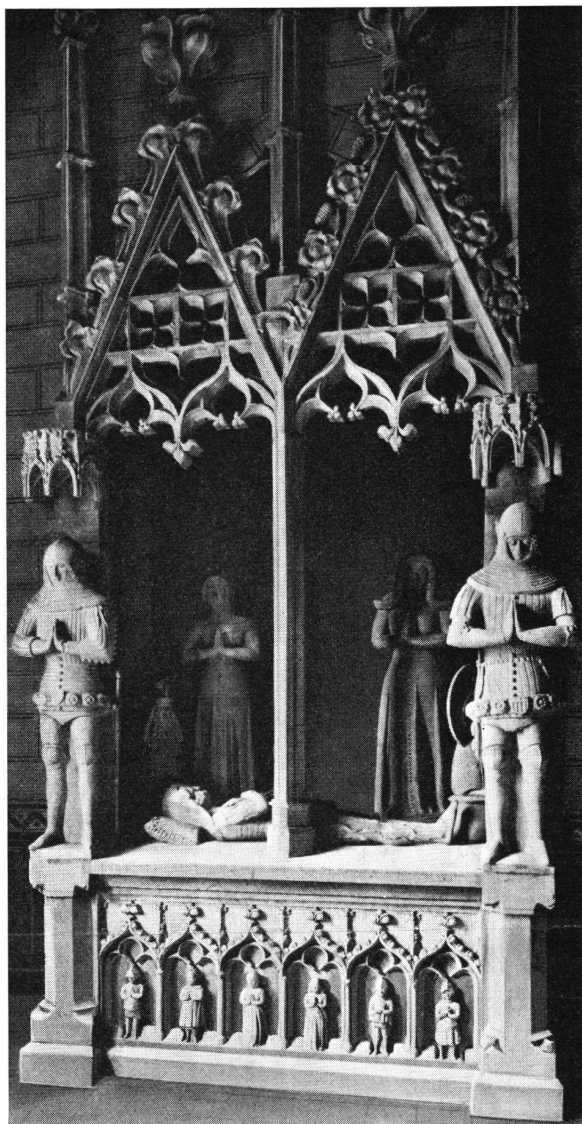
Grabmal, La Sarraz, Kanton Waadt. Ritter in Kampfausrüstung, um 1360.

Auf der andern Seite ist der kulturhistorische Bereich in vermehrtem Maße zu erforschen und zu klären. Dieser ist, so will uns scheinen, noch vielgestaltiger und bunter als wir bis anhin annahmen. Die zukünftigen Untersuchungen werden noch einen großen Reich-