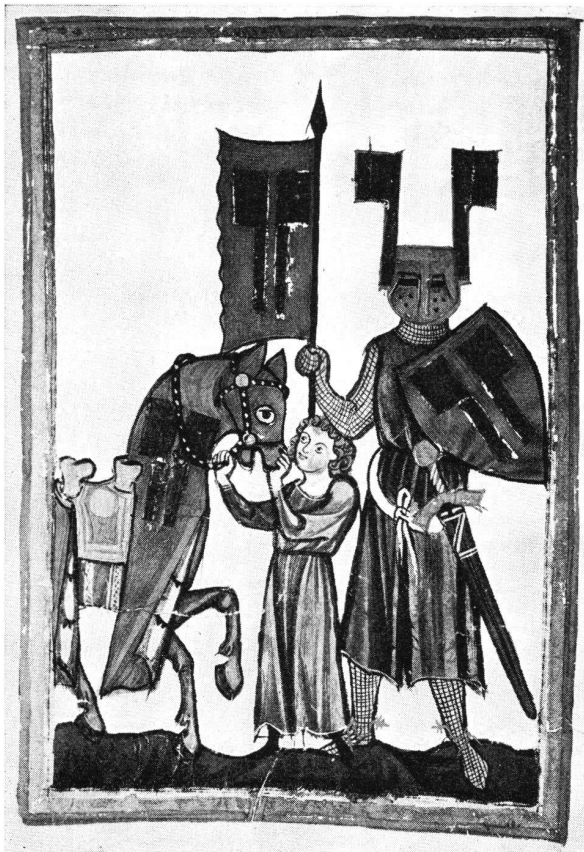
Wolfram von Eschenbach, in voller Kampfausrüstung, mit Knappe. Manessische Liederhandschrift, um 1320.

werden, welche zum Teil bisherige Ansichten, allein basierend auf den schriftlichen Quellen, nicht nur ergänzten, sondern vielfach sogar widerlegten und zu einer Neuüberprüfung des gesamten Fragenkomplexes zwangen.