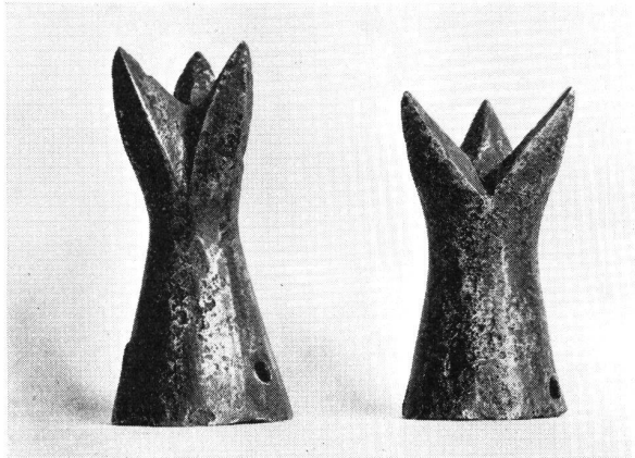
Zwei Turnierkrönlein aus Eisen (Länge 8 und 9,5 cm). Gefunden auf der Burg Waldeck.