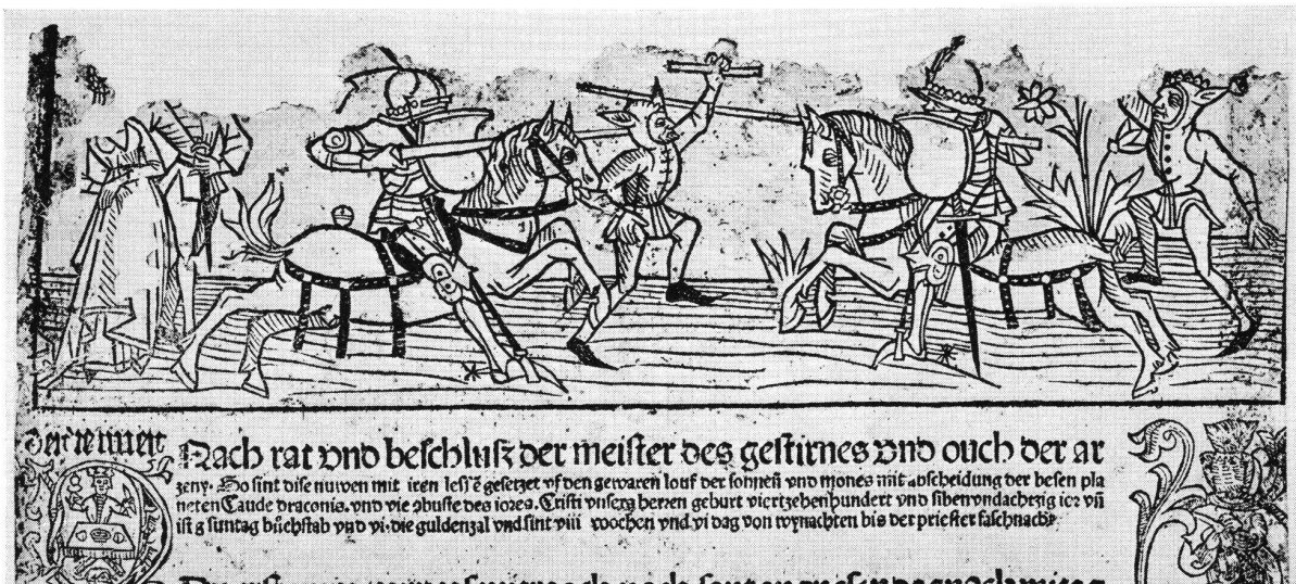
Turnierszene. Holzschnitt von einem Kalenderblatt aus der Zeit um 1480. Die Ritter tragen in voller Kriegsausrüstung mit scharfen Lanzen eine Tjost aus. Die Narren weisen auf den fastnächtlichen Charakter des Anlasses hin.

ritterliche Kriegswaffe nicht mehr gebräuchlich, hat bei den Turnieren bis ins 14. Jahrhundert hinein immer wieder Verwendung gefunden. Die Keule, eines der ertümlichsten Kriegsgeräte überhaupt, ist als Waffe für den Ernstfall schon im Verlaufe des 1. Jahrtausends verschwunden, unter der französischen Bezeichnung «masse», italienisch «mazza», deutsch «slegel» diente sie im Turnier als Nahkampfwaffe bis ins 15. Jahrhundert.