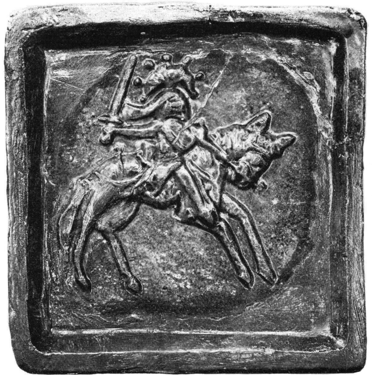
Ofenkachel mit Darstellung eines Ritters in kriegsmäßiger Ausrüstung: Dreieckiger Schild, Topfhelm mit gewaltiger Helmzier; die Rechte schwingt ein Schwert. Darstellung auf einer Blattkachel aus rot gebranntem und olivgrün glasiertem Ton, Mitte 14. Jahrhundert. Fundort Burg Bischofstein bei Sissach.

Erscheinen jährlich sechsmal XLVI. Jahrgang 1973 9. Band Sept.-Okt. Nr. 5