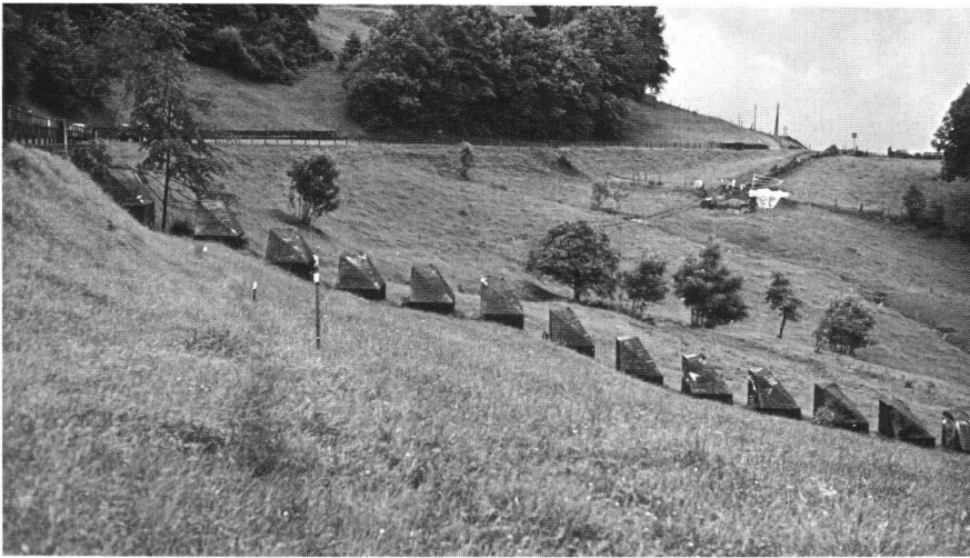
Situation der Letzi Beglingen