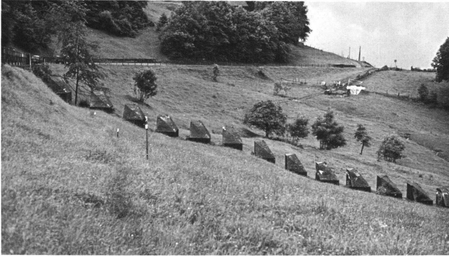
Situation der Letzi Beglingen