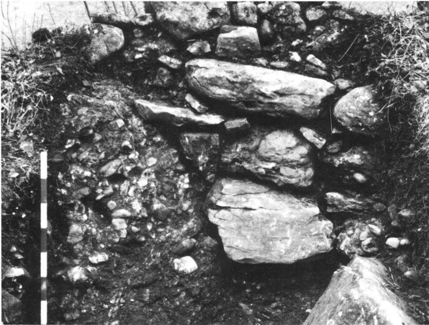
Letzi Arth/Sonnenberg. Sicht von Osten (Verteidigerseite) an die freigelegten Mauerfundamente. Auffällig ist, dass Bergsturzmateriale, z. B. der Nagelflubbrocken links, in die Konstruktion einbezogen worden ist.

Höhe und Bauart unbekannt ist die Brustwehr. Falls diese wie auf der Zeichnung von Schilling Zinnen aufwies, wird mit ungefähr 1,7 m zusätzlicher Mauerhöhe zu rechnen sein, so dass die Gesamthöhe bei etwa 3,9 m anzunehmen ist.