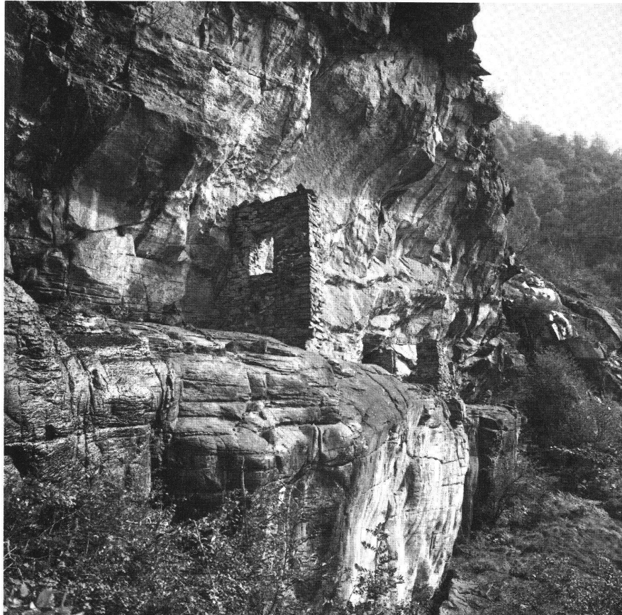
Dongio, Casa dei Pagani von S.

gen, was darauf hinweist, dass die hochmittelalterlichen Herrschaftsverhältnisse in ihren Hauptzügen auf frühmittelalterlichen Grundlagen fussen.