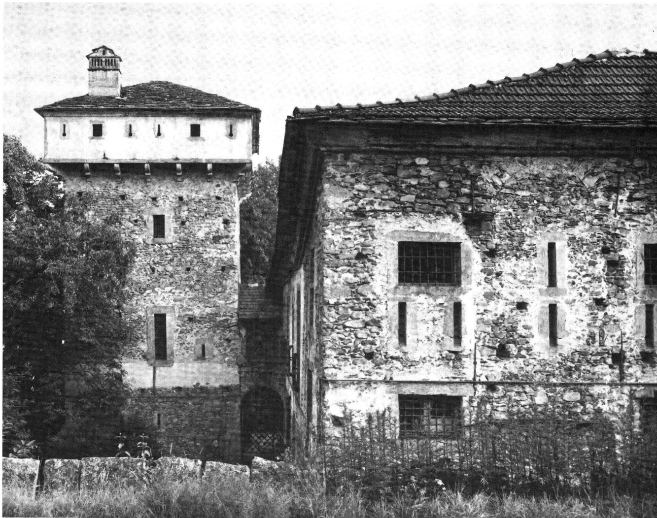
Casa di Ferro, Minusio.

Herren dem Zerfall preisgegeben, weil sich ihr Unterhalt nicht zu lohnen schien, andere sind geschleift worden, damit sie als Stützpunkte eines Gegners ausser Betracht fielen. Unter der Herrschaft der eidgenössischen Landvögte sind im Tessin keine neuen Festungswerke entstanden, und auch die bestehenden Anlagen wurden der Entwicklung der Kriegs- und Belagerungstechnik nicht mehr angepasst. Dagegen sind noch im 16. und 17. Jahrhundert von vornehmen, reichen Privatleuten repräsentative Schlossbauten errichtet worden, bei denen Zinnen, Erker und sonstige Elemente mittelalterlicher Wehrarchitektur in dekorativer Anordnung Verwendung fanden. Mit den schlossartigen Herrensitzen vom Typus der Casa di Ferro bei Minusio oder des Castello dei Marcacci zu Brione klang in den «ennetbirgischen Vogteien» der mittelalterliche Burgenbau aus.