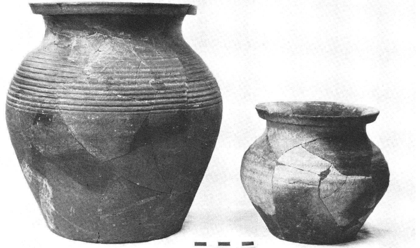
Kochtöpfe aus dem 13. Jahrhundert.

Es wird empfohlen, den Besuch der Ausstellung mit einer Besichtigung des in unmittelbarer Nähe gelegenen Urner Mineralienmuseums zu verbinden.