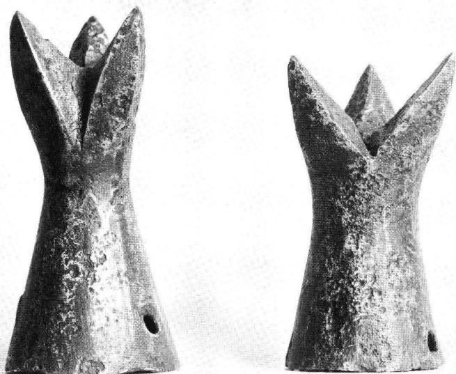
Turnierkrönlein aus Eisen (Länge 8 und 9,5 cm). Gefunden auf der Burg Waldeck.

form, die durch Repräsentation und Exklusivität gekennzeichnet war. Gepflegt wurde die ritterliche Kultur in den städtischen Zentren und an den Fürstenhöfen. Ihre Ausdrucksmittel waren die Turniere (die Kampfspiele), der Minnedienst und das Wappenwesen. Durch seine verfeinerte Lebensart hob sich der Ritter auch bei alltäglichen Verrichtungen, z. B. auf der Jagd, von der breiten Masse ab.