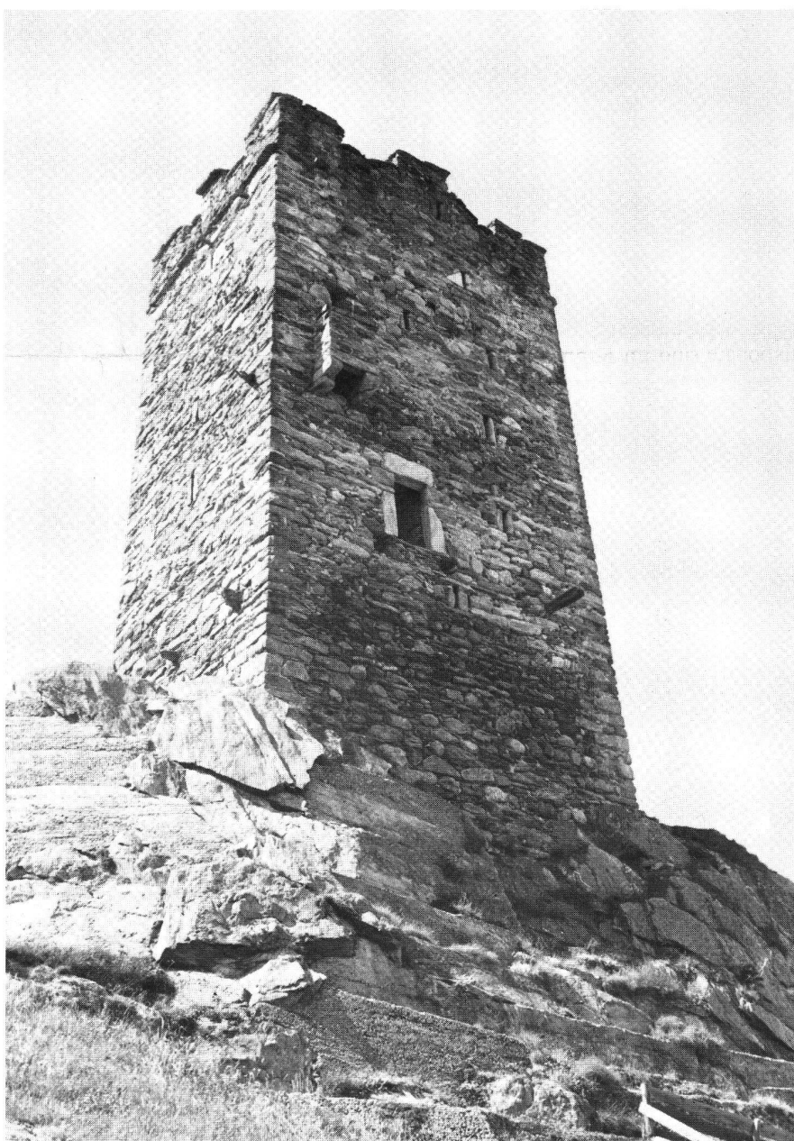
Hospental. Wobnturm aus dem frühen 13. Jahrhundert mit Hocheingang und Aborterker.

den Grabungsergebnissen lieferten. Vom Aufschwung der Mittelalter-Archäologie sind auch die Landesbefestigungen, die «Letzinen», erfasst worden (Stansstad, Rothenthurm). In der Schriftenreihe des Schweizerischen Burgenvereins ist 1984 eine ausführliche Zusammenstellung über die Forschungsergebnisse der Burgengrabungen