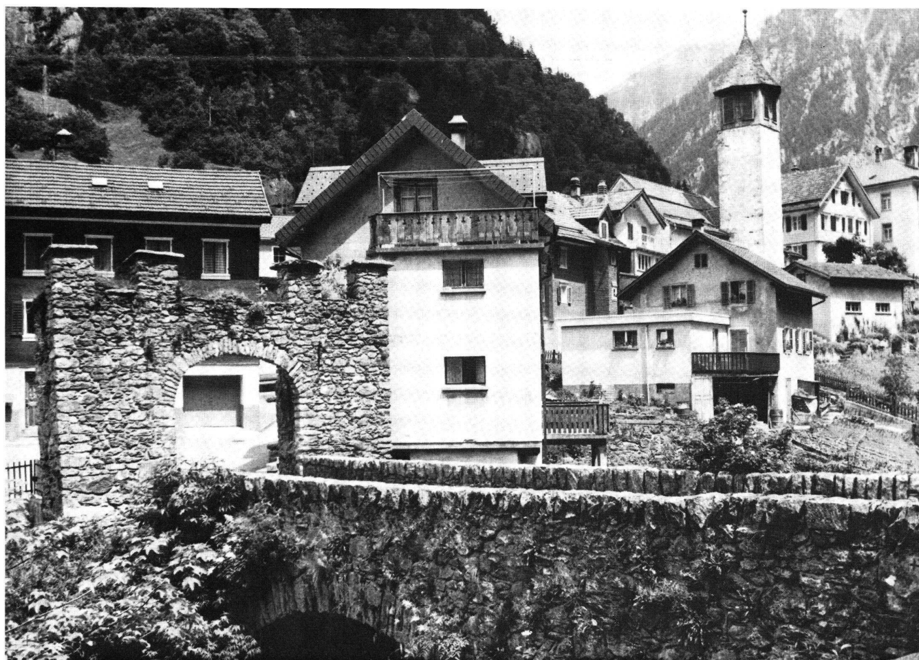
Göschenen. Neben dem Brückentor stand ein im 13. Jahrhundert urkundlich erwähnter Burgturm.

Vom ältesten Burgentyp, dem reinen Holz- und Erdbau des 10./11. Jahrhunderts, haben sich in der Innerschweiz keine Spuren erhalten. Frühe Formen der Steinburg mit weitem Ringmauerlauf und hölzerner Überbauung des Innern sind in Unterwalden belegt, auf dem Landenberg/Sarnen und auf dem Rotzberg. Die meisten Anlagen gehören in die klassische Zeit des Burgenbaues und sind zwischen dem späten 12. und dem ausgehenden 13. Jahrhundert entstanden. Ihr charakteristisches Merkmal ist der markante, viereckige Hauptturm mit hölzernem Oberbau. Repräsentative Steinhäuser stehen in Attinghausen (Schweinsberg) und Silenen. Der Hauptturm diente als wehrhafter Wohnbau und als ritterliches Statussymbol. In einzelnen Ortschaften