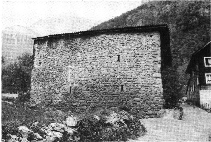
Silenen, Steinhaus im Tägerlobn.

Die Ausstellung umfasst originale und kopierte Fundgegenstände, Photographien, Reproduktionen alter Abbildun-