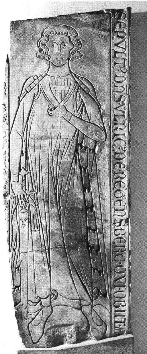
Grabplatte Ulrichs I. von Regensburg.