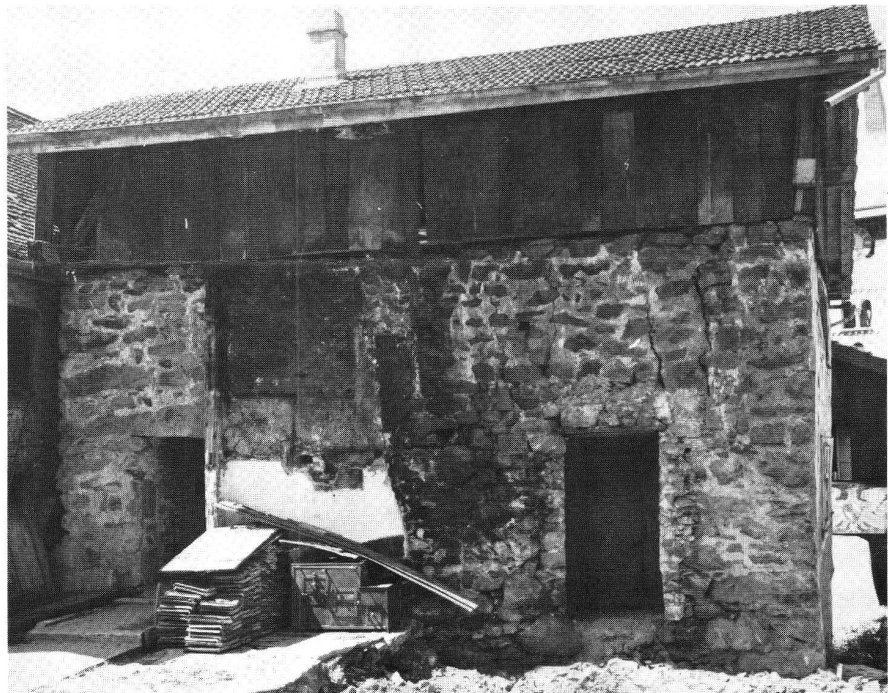
Wattigwilerturm in Bürglen, Zustand vor der Restaurierung.

gen, graphische Darstellungen und erläuternde Texte. Als besondere Prunkstücke dürfen die von P. Schaad, Rheinfelden, eigens für diesen Anlass hergestellten Burgenmodelle betrachtet werden. Inhaltlich ist die Ausstellung in mehrere Teile gegliedert, die nachstehend kurz vorgestellt werden sollen.