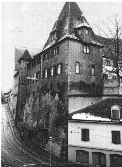
Der Basler Lohnhof vom Kohlenberg, dem ebemaligen Graben der inneren Stadtmauer, her gesehen. Im Hintergrund die Leonhardskirche. Zustand vor Verputzerneruerung 1986.

Im 1986 angegangenen Teilstück galt das Interesse besonders der am Kohlenberg liegenden Stützmauer, wo ein Teil der inneren Stadtmauer aus der Zeit um 1200 zu erwarten war. Zur Überraschung der Untersucher kam in den Sondierungen – der Verputz konnte nur teilweise entfernt werden – nicht nur Mauerwerk, das von der Qualität her zuverlässig als die gesuchte Stadtmauer zu deuten ist, zum Vorschein, sondern auch der obere Abschluss in Form von Zinnen (s. Plan). Diese liegen auf jener Höhe, wo im spätem 15. Jahrhundert in der anschliessenden Kirchenfassade ein Kaffgesims eingesetzt wurde. Neben Veränderungen an den Zinnen, wohl aus dem 14. Jahrhundert – damals wurden die Zinnenöffnungen zu Fenstern mit durch Fälze belegten Klappläden umgestaltet – war zu erkennen, dass der Oberteil der Fassade mit den Zellenfenstern einheitlich erst aus der Zeit des Gefängnisbaues im 19. Jahrhundert stammt. Die auf Matthäus Merians Stadtansicht erkenntlichen, dem Stadtmauerrest aufgesetzten Gebäude waren in diesem Abschnitt nicht nachzuweisen.