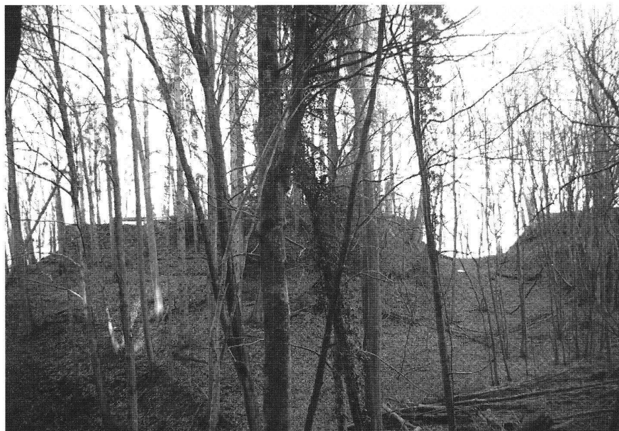
Alt-Deettingen von Süden, links Reste der Umfassungsmauer, rechts der künstlich angelegte Halsgraben.