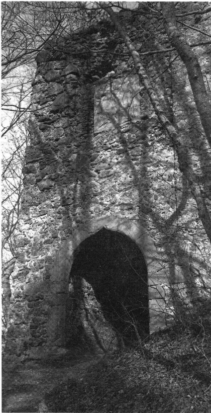
Alt-Bodman, Eingangsbereich des unteren Zwingers.

Der obere Zwinger gehört zur ursprünglichen Anlage des frühen 14. Jahrhunderts, während der untere Zwinger mit dem Burgtor eine Erweiterung wohl der Zeit um 1500 darstellt. Auch die aus der Mauerflucht ausgreifenden Rondelle zur Erreichung eines besseren Schussfeldes sind angesetzt und sicherlich eine spätere Zutat. Kernstück der Anlage ist der viergeschossige, mit einem Pultdach versehene Palas, der heute noch bis zu 30 m hoch aufragt und eine Grundfläche von 16 auf 18 m aufweist. Er vereinigt Schildmauer und repräsentatives Wohngebäude in sich. Zur Angriffsseite hin sind die Mauern des Turmes in der Art eines Schildes konvex ausgeführt, um Geschosse besser abgleiten zu lassen. Auf dieser Seite findet sich auch nur ein Fenster im 3. Obergeschoss. Darüber verläuft ein mit Schiessscharten ausgestatteter Wehrgang. Die anderen, der Hauptangriffsseite abgewandten Wände sind reicher befenstert, die dem See zugerichtete Nordseite sogar mit einem Balkon versehen. Die Innenausstattung muss üppig gewesen sein, die Quellen erwähnen sogar eine «ganze übergülte stuben». 1643 wurde die Burg von französischen Truppen