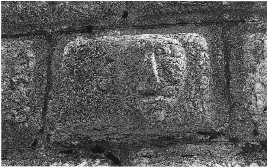
Buristurm, grosser Kalksteinquader mit einfacher, kräftig gestalteter Fratze, um 1535.

Einschlagen von Pfahlreihen zum Schutz gegen Erosion, wird berichtet. Über die Jahrhunderte zogen sich besonders die Baumassnahmen an den Stadttoren hin. Das Bieltor etwa hat durch wenigstens fünf grössere Bauphasen die aktuelle Gestalt erhalten. Ein bescheidener Torbau wurde noch im späten Mittelalter in zwei Schritten auf etwa die doppelte Höhe aufgeführt, im Innern in mehrere Stockwerke unterteilt und mit einem neuen Torgewände ausgestattet. Das Dach stammt aus späteren Jahrhunderten und hat mit der ursprünglichen Verteidigungsaufgabe des Turms nichts mehr zu tun.