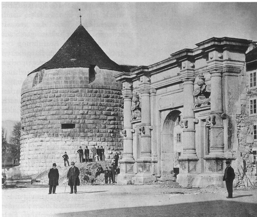
Aufnahme des Äusseren Bieltors kurz vor dem Abbruch im Jahr 1871 (die anschließenden Schanzenmauern waren zu diesem Zeitpunkt bereits beseitigt). Im Hintergrund Buristurm.

Bauarbeiten zum Opfer, etwa beim Ausbrechen von Fensteröffnungen. In der Regeneration begann auch in Solothurn die Phase der sogenannten Entfestigung. 1835 beschloss die Kantonsregierung, die Schulschanze beim Baseltor abzubrechen. Als stadthistorisches Ereignis ist der Entscheid bemerkenswert, dass vom 17. Oktober 1835 an die Stadttore abends nicht mehr geschlossen werden sollten. Im folgenden Jahr wurde auch das Äussere Baseltor abgebrochen, im nächsten die Schanzengraben vor dem Bieltor zugeschüttet.