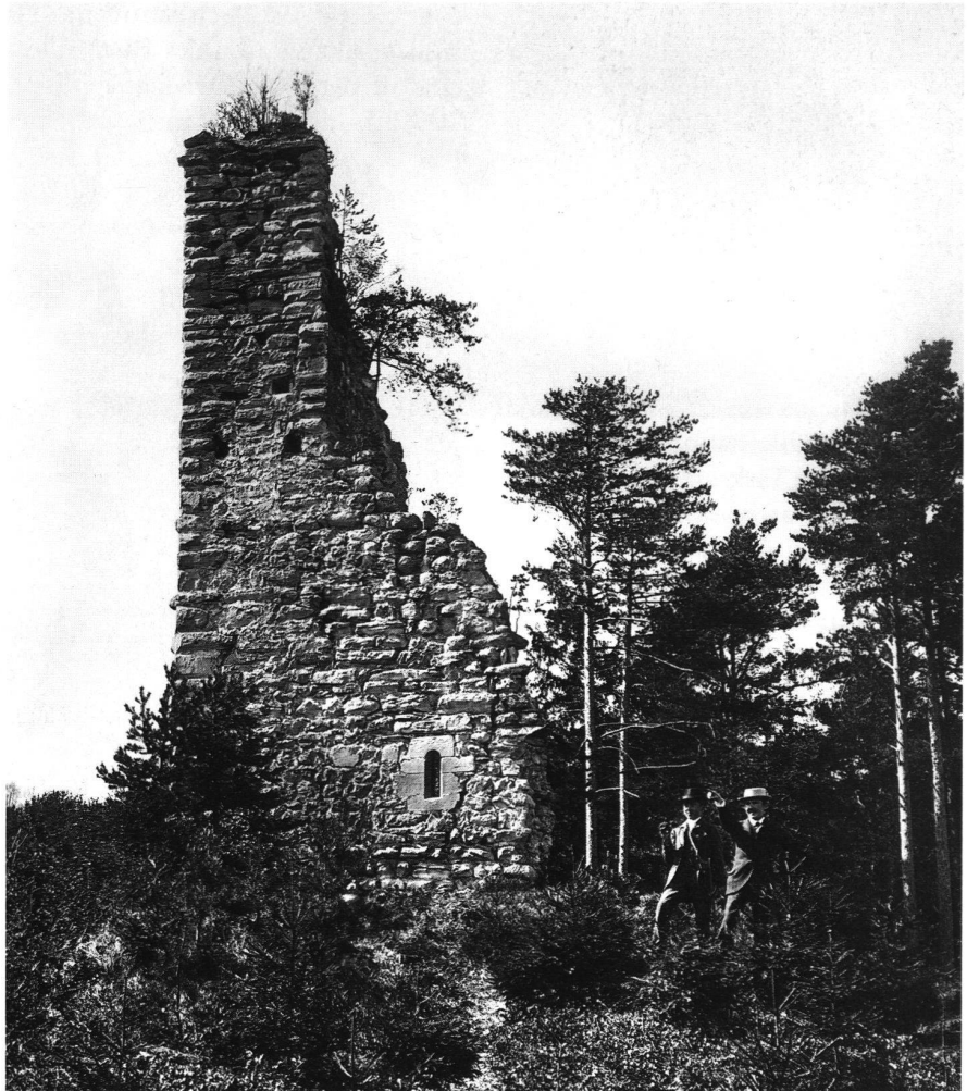
1: Burgruine Grimmenstein (St. Margrethen SG) um 1900.

Um 1900 begann man sich dann aber mit den zahlreichen Schlössern und Burgruinen zu befassen, wobei deren Sicherung und Restaurierung dringlichstes Anliegen war. 1899