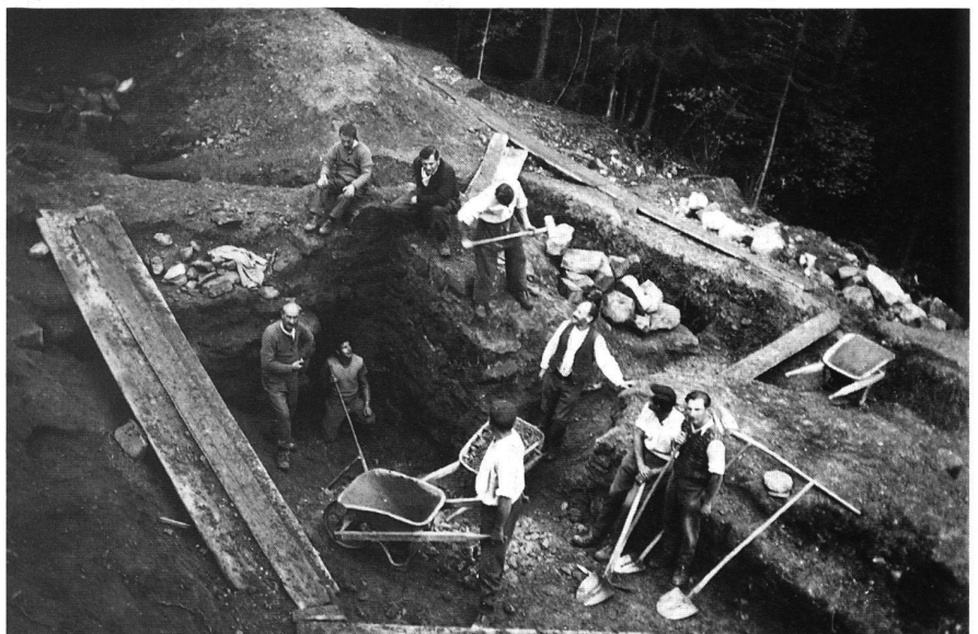
3: Ausgrabungsarbeiten auf Grimmenstein 1936.

Die Zeit der Arbeitslosenlager endete mit dem Beginn des Zweiten Weltkrieges, da die Kräfte abgezogen und anderweitig eingesetzt wurden. G. Felder hielt abschliessend die wichtigsten Ergebnisse