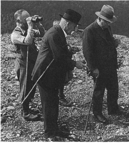
2: Dr. h.c. Gottlieb Felder (Mitte) 1936 bei der Besichtigung der Grabung auf Neu-Toggenburg (Oberhelfenschwil SG).

Vorstellungen der Ostschweizer Schulmethodik nannte 9 . Der Einfluss und die Tatkraft Felders, ganz im Stile des archäologischen «Patrons», sollten in der Ostschweiz in den folgenden Jahrzehnten eine rege Grabungs- und Sanierungstätigkeit auslösen. Ihm selbst wurde die liebevolle Anrede des «Burgenvaters» zuteil. G. Felder beschrieb den Umgang mit Burgen und Schlössern folgendermassen: «Wecken wollen wir die schlummernden nicht, jedenfalls nicht in dem Sinne, dass wir ans Wiederaufbauen gehen, wie man das andernorts tut, wo man über reiche Mittel zu verfügen hat, aber schützen und erhalten wollen wir die Ruinen als malerische Bereicherungen ihrer Landschaftsbilder und zur Nachdenklichkeit mahnende Zeugen verklungener Tage, Geschlechter und Lebensformen.» 10