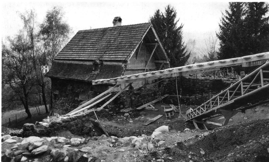
8: Ausgrabungsareal 1999 auf der Burgruine Gams (Gams SG).

Ein Nationalfondsprojekt des Kantons Appenzell Innerrhoden im Zusammenhang mit dem 600. Jahrestag der Schlacht am Stoos im Jahre 2005 soll mit der Bearbeitung der Altfunde von der Burgruine Clanx sowie der Erforschung des Erdwerkes Schönenbüel (Bezirk Rüte AI) neue Ansätze für die «Siedlungszelle» Appenzell erbringen.