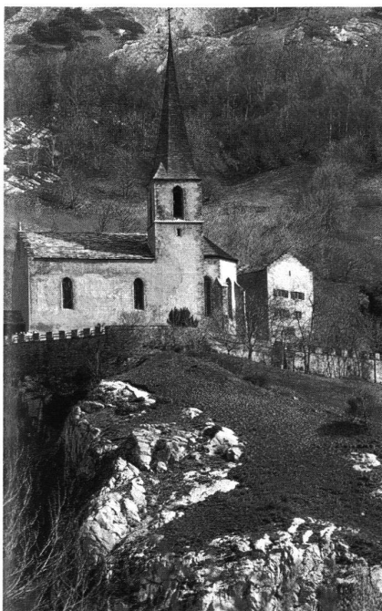
3: Raron, Burghügel. Ansicht von Süden mit Pfarrkirche St. Romanus (entstanden 1508–1517 durch Umbau eines Palas aus dem 14. Jahrhundert) und Wohnturm der Viztume, 12. Jahrhundert.

Als frühe Beispiele von Umnutzungen mittelalterlicher Wehrbauten seien die Pfarrkirche St. Romanus auf der Burg in Raron (Abb. 3) so-