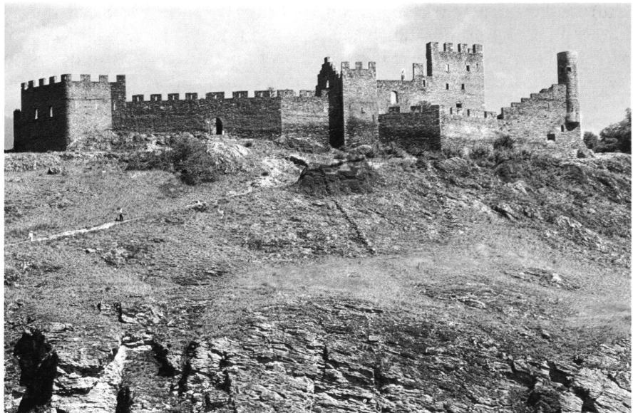
7: Sitten, Burgruine Tourbillon, beim Stadtbrand von 1788 eingäschert. Ansicht von Süden.

Von konkreten Projekten zum Bau eines Lifts bisher verschont geblieben ist die Ruine Tourbillon , die Ende des 13. Jahrhunderts als bischöfliche Burg mit innerem und äusserem Wehrbezirk errichtet worden ist (Abb. 7). Nach der teilweisen Zerstörung der Anlage in den Rarnerkriegen von 1417–1419 ist sie um die Mitte des 15. Jahrhunderts erneuert worden und diente bis zu ihrer Einäscherung anlässlich des Stadtbrandes von 1788 als Sommerresidenz des Bischofs. Die heutige, durch einen regelmässigen Zinnenkranz geprägte Silhouette geht auf Konsolidierungsarbeiten des ausgehenden 19. Jahrhunderts zurück. 1965–1971 erfolgte eine erste Restaurierungsetappe, welche die Burgkapelle samt dem nördlich angrenzenden jetzigen Wärterlokal aufwertete. Seit 1991 laufen die Fortsetzungs-