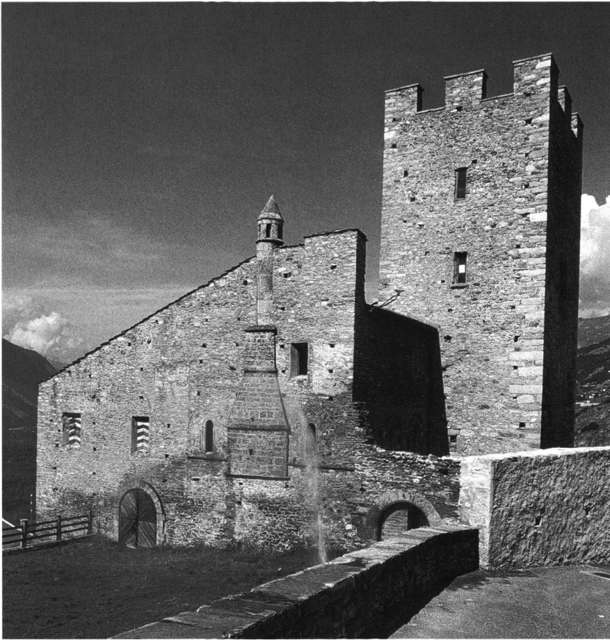
8: Leuk-Stadt, ehemaliges Bischofsschloss. Ansicht von Osten. Der Bau ist z.Z. Gegenstand eines Revitalisierungsprojektes.

Jahrhundert überragte mittelalterliche Baukomplex ist 1934 von der Gemeinde erworben worden. Seit den Ende der 1930er und 1950er Jahre unternommenen Konsolidierungsarbeiten verhartete die Ruine lange quasi in einem Dornröschenschlaf.