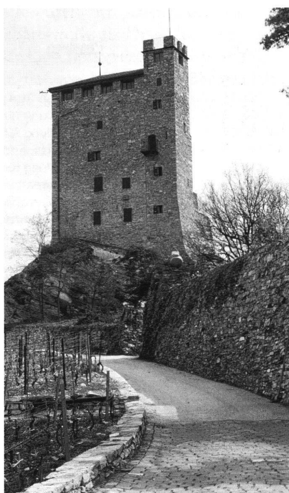
2: Sierre, Tour de Goubing, wohl 13. Jahrhundert. Ansicht von Westen.

die Turmburgen zu erwähnen, die dem Amtsadels und dem ländlichen Kleinadel als dauernder Amts- und Wohnsitz dienten (Abb. 2). Dank ihrer Nähe zu den Siedlungen sind viele dieser Wohntürme über die Jahrhunderte bewohnt worden und dadurch erhalten geblieben.