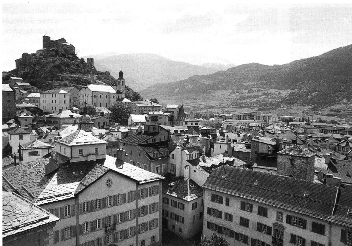
6: Blick vom Zinnenkranz des Kathedralturms auf die Kirchenburg Valeria.

Was im ersten Augenblick als reizvoll erscheinen mag, entpuppt sich bei näherem Hinsehen als zweischneidig. Die gegenwärtig laufenden Arbeiten auf der Valeria beschränken sich auf Konservierungs- und Instandsetzungsmassnahmen – mit Ausnahme des in den ehemaligen Wohngebäuden des Domkapitels nördlich der Kirche eingerichteten Museums, dessen veraltete Infrastruktur objektgerechteren Ausstellungsbedingungen gewichen ist. Abgesehen von der Tatsache, dass der Einbau des