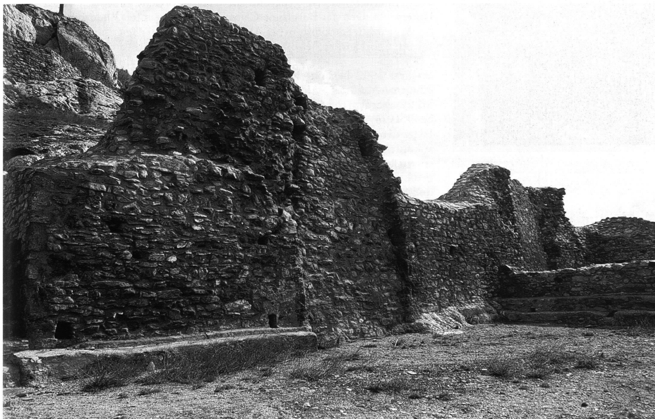
9: Niedergesteln, Ruine der 1384 zerstörten Gestelnburg. Blick nach Osten in den Hauptwohnraum des Erdgeschosses. In der Bildmitte Überreste des monumentalen Kamins aus der Bauzeit, eingefasst von später eingebauten Wandbänken.

Wissenschaftlicher Gewinn und touristische Erschliessung kontra langfristige Erhaltung unter schützendem Erdreich? Dieses für zahlreiche mittelalterliche Wehrbauten bestehende Dilemma gilt es von Fall zu Fall zu lösen, im Zweifelsfall für die Ruine.