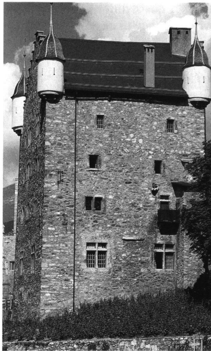
4: Leuk-Stadt, ehemaliger Turm der Viztume, 1541–43 zum Rathaus umgebaut.

wie das Rathaus in Leuk erwähnt. Als Baumeister fungierte in beiden Fällen der in Raron ansässige Prismeller Baumeister Ulrich Ruffiner. Der wehrhafte, wohl vom Bischof von Sitten im 14. Jahrhundert als Meierturm errichtete Palas im Süden des Rarner Burgbezirks wurde nach seiner teilweisen Zerstörung in den Rarner Wirren von 1417–1419 in den Jahren 1508–1517 zur Pfarrkirche umgebaut. An die alten, zum Schiff umfunktionierten Umfassungsmauern des Palas fügte Ruffiner Polygonalchor und Glockenturm.