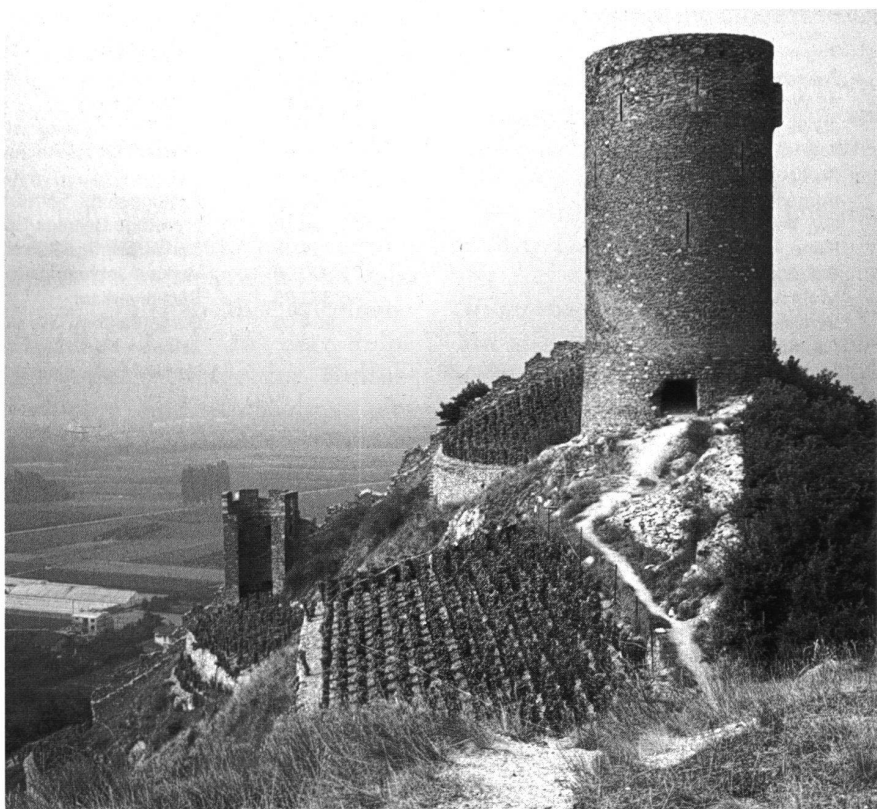
1: Saillon, Tour de Bayart, 1260/61. Ansicht von Osten.

Neben diesen grösseren, von Ringmauern umgebenen Burganlagen als den Mittelpunkten der zivilen und militärischen Verwaltung sind