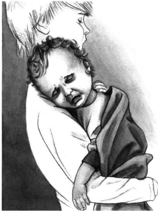
4: Baar-Früebergstrasse, Lebensbild. Die Säuglingssterblichkeit lag im Frühmittelalter wahrscheinlich bei etwa 20%. Zum Vergleich: In der Schweiz betrug sie im Jahr 2004 0,5%.