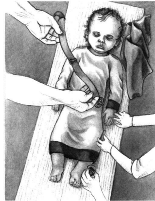
5: Baar-Früebergstrasse, Lebensbild. Herrichtung des verstorbenen Babys aus Grab 150.

die sich als Einziges vom Skelett erhalten haben, verstarb es im Alter von 9 bis 16 Monaten. Die Grabgrube war klein und entsprach einer Körperhöhe von etwa 70 cm. Wahrscheinlich wurde das Baby – wie fast alle anderen Verstorbenen auf dem Friedhof – auf dem Rücken liegend, mit dem Kopf gegen Westen und den Füßen gegen Osten weisend, in die Grabgrube gelegt. Die Lage der Grabbeigaben, die das Grab in die erste Hälfte des 7. Jahrhunderts datieren, lässt sich folgendermassen rekonstruieren (Abb. 5 und 6): Quer über dem Oberkörper lag ein Ledergürtel (Abb. 6,1 und 6,2), an der Aussenseite des linken Beines lagen ein Messer (Abb. 6,3) und