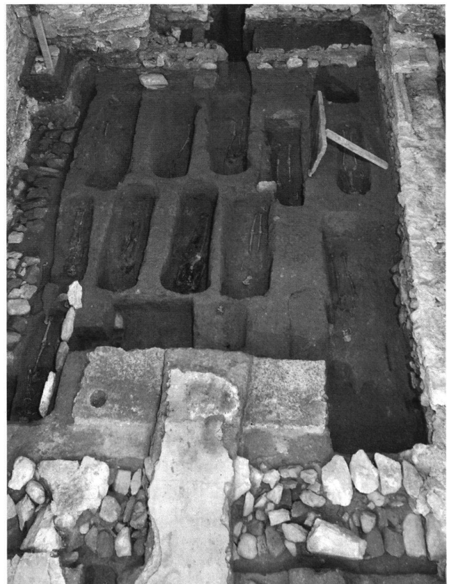
8: Risch, St. Verena. Von der ältesten Kirche haben sich einzig die Bestattungen erhalten, die im Schiff lagen. Blick von Westen.

Zurzeit werden die archäologischen Untersuchungen in den mittelalterlichen Kirchen des Kantons Zug systematisch ausgewertet. Das Ziel ist eine monographische Publikation der Resultate im Zusammenhang mit einer Geschichte der Zuger Pfarreien während des Mittelalters.