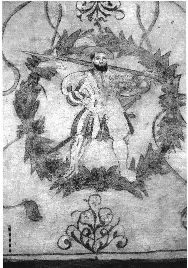
19: Zug, Unteraltstadt 9. Westraum im zweiten Obergeschoss, Nordwand. Ansicht des rechten Reisläufers.

Wichtige Schweizer Künstler widmeten sich ausgiebig dem Motiv des Reisläufers, wie zum Beispiel Niklaus Manuel Deutsch und Urs Graf. Im Vergleich mit Druckblättern des 16. Jahrhunderts entsprechen die Reisläufer im Haus an der Unteraltstadt 9 dem Darstellungstyp des stolzen Soldaten ohne grosse Dynamik in der Bewe-