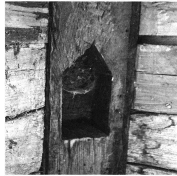
27: Hünenberg, Burgstrasse (abgebrochen, Foto 2001). Nische im Eckständer der Stube, sogenannter Herrgottswinkel, datiert 1598.

Haus auf der südlichen Giebelseite einen weiteren, ähnlich organisierten Wohnteil.