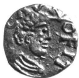
1: Acaunum/St-Maurice, Abtei, Monetar Romanus, Triens (um 630–640). Vorderseite Brustbild mit Diadem (Inv. S 855).

Bei beiden Ausstellungen stehen Münzfunde, die auf dem Gebiet der heutigen Schweiz zwischen dem 7. und 12. Jh. verborgen wurden, im Zentrum. Sie bilden gewissermassen einen roten Faden durch die Ausstellung. Münzfunde sind eine wichtige Quelle zum mittelalterlichen Geldwesen – in manchen Perioden sogar fast die einzige –, ihre Zusammensetzung weist auf Verkehrs- und Handelsanbindungen, die weit über die spätere Schweiz hinausreichen. Mit zahlreichen Leihgaben aus Museen und archäologischen Diensten gibt die Ausstellung einen repräsentativen Überblick über das im Früh- und Hochmittelalter zirkulierende Geld; unter den ausgestellten Funden sind solche, die aus der Literatur wohlbekannt sind, aber auch einige – darunter neue –, die bisher noch nie ausgestellt waren.