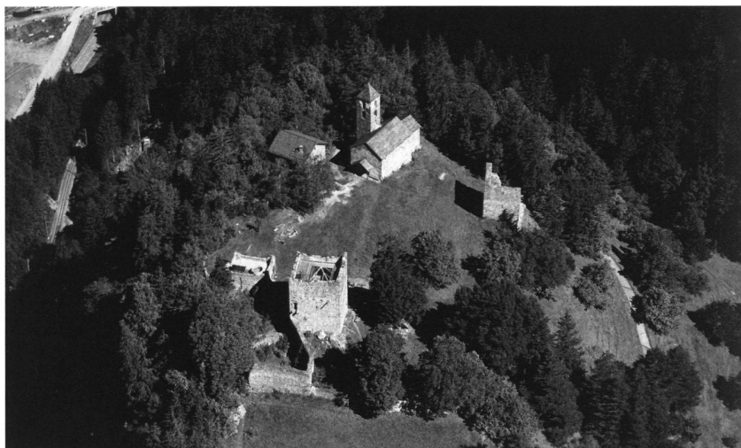
4: Sils im Domleschg GR, Burganlage Hohenrätien mit Pfarrkirche St. Johannes Baptist. Luftaufnahme.

Neben den Funden mit einheimischem und fremdem Geld werden die Prägungen zu sehen sein, die in der Schweiz selbst hergestellt wurden. Seit dem 6. Jh. sind in der späteren Schweiz Münzstätten aktiv, zunächst nur im Westen, am Rande des merowingischen Reichs, dann ab etwa 900 auch in den östlichen Landesteilen.