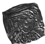
3: Reichenau, Abtei, Ulrich IV. von Heidegg (1159–1169), Pfennig. Vorderseite Büste von vorn mit Tonsur. Inv. S 5426 (aus dem Schatzfund von Steckborn, 1883).

Neben den Funden mit einheimischem und fremdem Geld werden die Prägungen zu sehen sein, die in der Schweiz selbst hergestellt wurden. Seit dem 6. Jh. sind in der späteren Schweiz Münzstätten aktiv, zunächst nur im Westen, am Rande des merowingischen Reichs, dann ab etwa 900 auch in den östlichen Landesteilen.